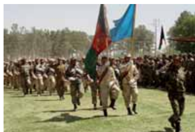
مراسم خلع سلاح افراد مسلح تحت پروگرام (DDR)

بعد از سرنگونی رژیم طالبان، در افغانستان استحکام سیستم نظام بر اساس دیموکراسی ایجاد گردید. جاپان برای ساختن قانون اساسی جدید متخصصین خویشرا را فرستاد. همچنان کمکهای مالی را برای انتخابات ریاست جمهوری و پارلمان انجام داد. برای مراقبت و نظارت از جریان رای دهی متخصصین خویش را فرستاد. در نتیجه همکاریهای جاپان و کشورهای جهان در ماه قوس سال ۱۳۸۴ با افتتاح پارلمان جدید افغانستان، پروگرام [تحکیم صلح] به اتمام رسید.