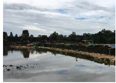
គម្រោងជួសជុលផ្លូវលំខាងលិចអង្គរវត្ត