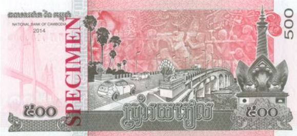
រូបភាពប្រាក់ 500 រៀល

ដែលរាជរដ្ឋាភិបាលកម្ពុជាបានលើកជាបញ្ហានោះ មានគម្លាតពីគ្នា។