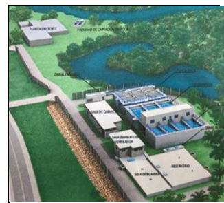
Instalación del Sistema de Agua Potable de la Ciudad de Coronel Oviedo visitado durante el estudio de campo (Imagen del futuro edificio culminado)

La relevancia de la política es alta habiéndose encontrado congruencias entre las necesidades de desarrollo del Paraguay, la política superior de AOD del Japón y los desafíos prioritarios a nivel mundial. Por otro lado, en el objetivo medio de la “Política de Asistencia al Paraguay” -Reducción de la brecha de desigualdad-, no se han encontrado detalles de “cómo tomar acciones ante cada tipo de desigualdad”. Se puede decir que es un desafío a mejorar en ocasión de la elaboración de la Política de Asistencia.