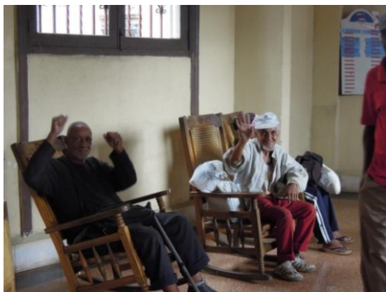
Ancianos saludando en el comedor 116 apoyado por la APC, "El Proyecto de Rehabilitación del Comedor 116 para Atención Comunitaria de la Tercera Edad"