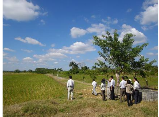
Campo experimental del Instituto de Investigaciones de Granos