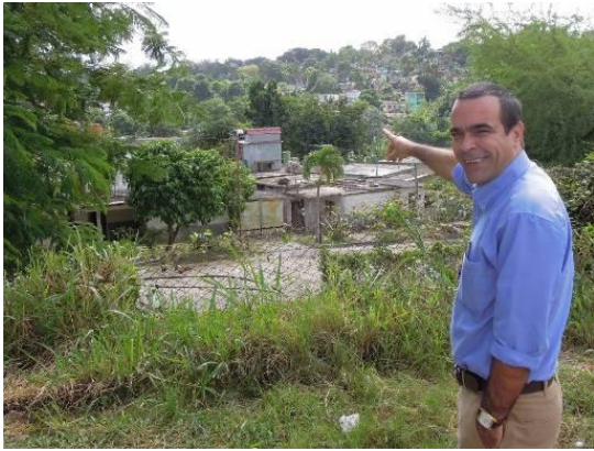
Contraparte del Grupo de Trabajo Estatal para el Saneamiento, Conservación y Desarrollo de la Bahía de La Habana