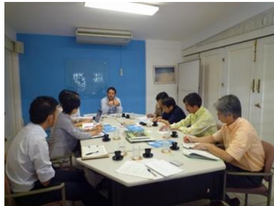
Entrevista al personal del Programa de las Naciones Unidas para el Desarrollo