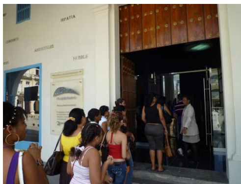
Ciudadanos forman una fila para ver el planetario

En conmemoración del octogésimo aniversario de las relaciones diplomáticas entre Japón y Cuba, Japón realizó la provisión de los equipos del planetario que se encuentra dentro del Centro Cultural para la Ciencia y Tecnología en la Habana Vieja mediante la Donación Cultural: “El Plan de Mejoramiento de los Equipos del Planetario de la Oficina del Historiador de La Habana” (2006). El objetivo fue apoyar al plan de instalación del planetario de la Oficina del Historiador de La Habana que se encontraba suspendido por la difícil situación financiera. El planetario inaugurado ha estado lleno todos los días desde su apertura en el año 2010, llegando a los 110,000 visitantes en total. Lo visitan estudiantes de los colegios y universidades como parte del programa de educación y también niños y personas de la tercera edad para los programas especiales. El planetario ofrece también los eventos de tecnología científica a nivel internacional, siendo un centro de intercambio de conocimientos de la población sobrepasando las funciones tradicionales del centro cultural. En la entrada, se encuentra una placa con el nombre del astronauta japonés, Mamoru Mouri, y la