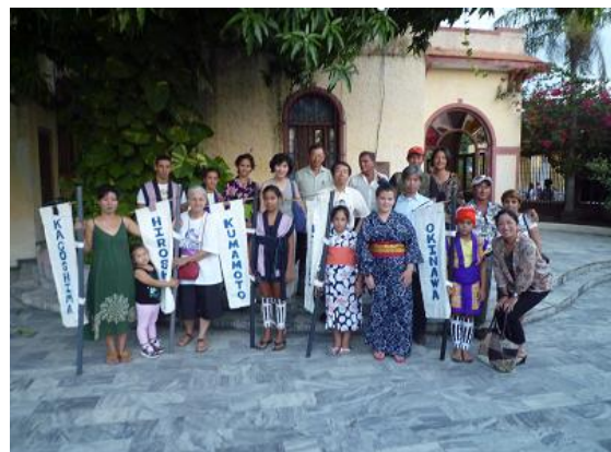
Asociación de los Inmigrantes Japoneses de la Isla de la Juventud