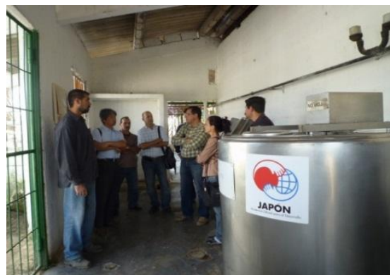
Tanque de leche donado por la Asistencia Financiera No Reembolsable para Proyectos Comunitarios de Seguridad Humana (APC), "El Proyecto de Mejoramiento de la Calidad Productiva de Leche en el Municipio de San José de las Lajas de la Provincia de La Habana" y beneficiarios