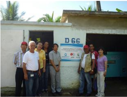
Bomba del agua donada por la APC, "El Proyecto de Mejoras en los Sistemas de Abastecimiento de Agua Potable y Saneamiento en la Isla de La Juventud"