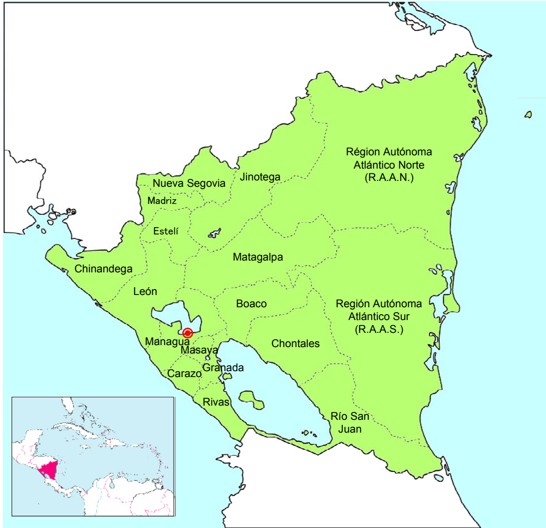
Mapa de Nicaragua