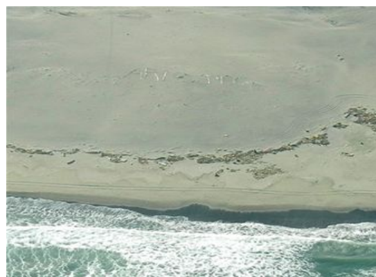
仙台空港近くの砂浜に書かれたメッセージ 「ARIGATO」