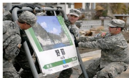
仙石線野蒜駅(宮城県東松島市)において、鉄道の復旧活動に従事する米陸軍