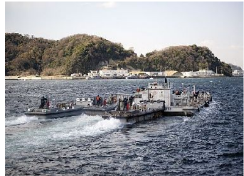
淡水を輸送するバージ船

消防車2台(実際の放水活動で使用。)及びポンプ5基の輸送・提供、防護服・マスク99セットの提供(さらに、同種の防護服150セットを東電に提供できる状態にしていた)、ホウ素約9tの輸送・提供、米海軍のバージ(はしけ)船2隻による淡水約190万リットルの提供。海兵隊の放射能対処専門部隊(CBIRF)約150名を日本に派遣。米軍無人偵察機「グローバル・ホーク」等が撮影した写真を日本側に提供。