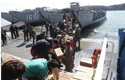
被災者と共に物資を積みおろす米海兵隊

第31海兵機動展開隊(31MEU)を載せた強襲揚陸艦「エセックス」等が支援物資の輸送、提供を行った。31MEUの一部は、3月27日~4月6日に気仙沼市大島(宮城県)に上陸用舟艇で給電車、給水車を輸送した上で、人道支援活動を行った。