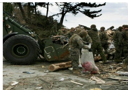
瓦礫の撤去に従事する米海兵隊