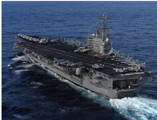
空母「ロナルド・レーガン」

船に輸送し、自衛隊が宮城県内に輸送する日米共同対応を実施した。その後、同空母等は、随伴する艦船とともに、岩手県沖にて、捜索救助活動や人道支援物資の輸送・提供活動を行い、4月5日迄に被災地沖海域を離れた。救難艦「セーフガード」が八戸港、宮古港で障害物除去活動を行った。4月1~3日、人員約9,000人、艦船6隻、航空機10機を投入して、自衛隊等と共に、三陸沖にて行方不明者の合同捜索救助活動を行った。