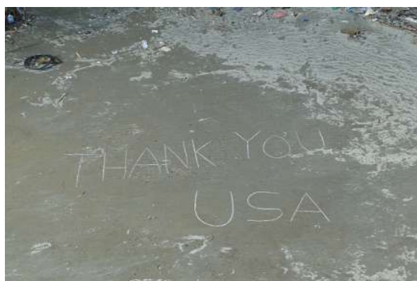
宮城県女川町で地上に書かれたメッセージ 「THANK YOU USA」