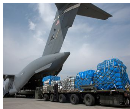
輸送機への荷物の積み込み

C130輸送機が3月15日にガソリン給油車を山形空港に輸送し、同空港での燃料供給を実施した。また、C130輸送機等が医薬品を仙台空港等に輸送し、提供した。また、無人偵察機「グローバル・ホーク」等が撮影した画像を日本側に提供した。