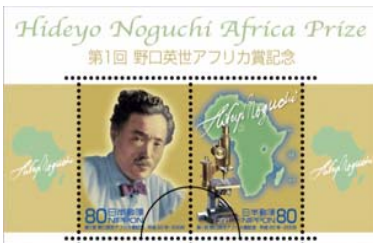
特殊切手デザイン