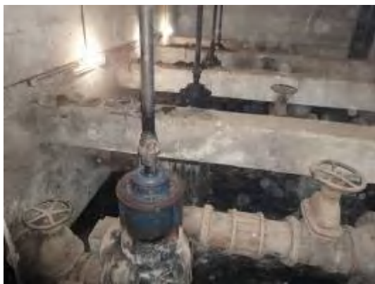
劣化した排水ポンプ