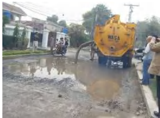
冠水した道路に出動する汚泥吸引車