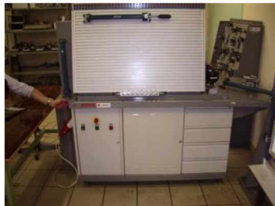
既存機材（油圧システム実習装置）