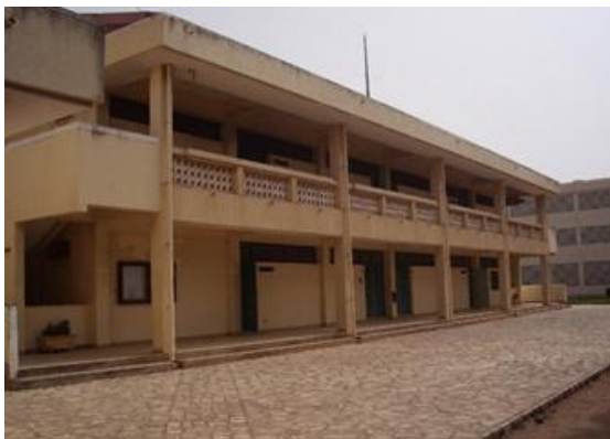
セネガル・日本職業訓練センター 電子実習棟外観