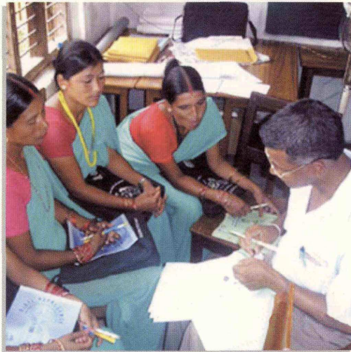
結核対策ワークショップ(ネパール) c