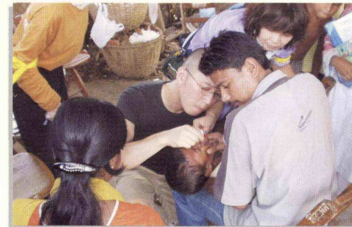
ポリオの経口ワクチン接種( Bangladesh ) d