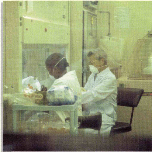
エイズ検査キットの開発(ケニア中央医学研究所) b