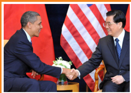
ソウルでの米中首脳会談で、握手を交わすオバマ米大統領と胡錦濤中国国家主席（2010年11月11日）。