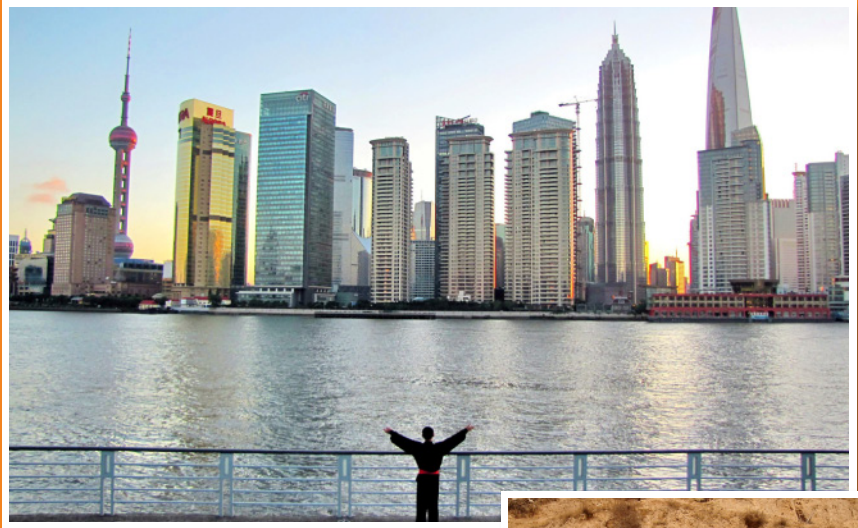
都市部（上海）は発展を続ける一方、「貧困県」（山西省静楽県）では洞穴式住居・ヤオンが残る。