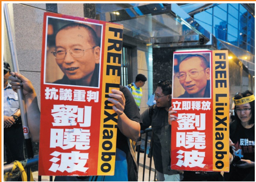
ノーベル平和賞受賞が決まった劉曉波氏の釈放を求める香港のデモ（2010年10月8日）。