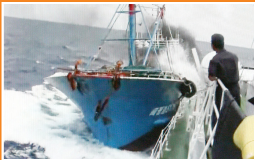
沖縄県・尖閣諸島沖で海上保安庁巡視船と中国漁船が衝突する状況を記録したとみられる映像。 [動画投稿サイト「You Tube(ユーチューブ)」より][写真/時事]