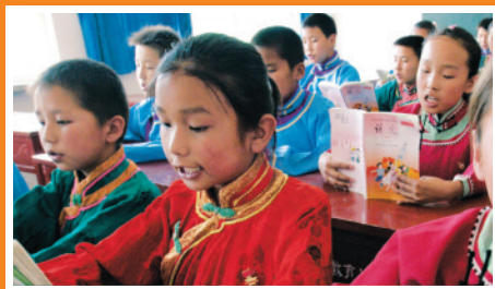
新疆ウイグル自治区では、少数民族の全ての児童・生徒に現地語と標準語の「双語（バイリンガル）」教育を行っている。