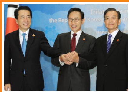
ベトナムで行われた日中韓首脳会談の前に握手する菅首相、李明博韓国大統領（中央）、温家宝中国首相（右）（2010年10月29日）。