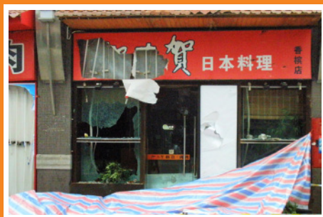
中国・成都で起こった反日デモで、ガラスを割られた日本料理店(2010年10月17日)。