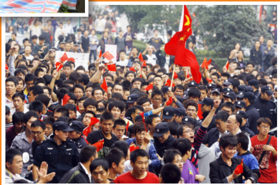
中国・武漢で行われた反日デモ(2010年10月18日)。