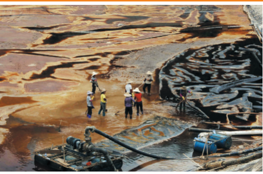
汚水流出で周辺の水質を著しく汚染した福建省の銅採掘企業の事故現場。