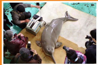
環境汚染が進む中、ヨウスコウカワイルカ（揚子江生息の淡水イルカ）もすでに絶滅した可能性が高いという。