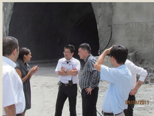
道路状況を調査する日本人専門家とキルギス側担当者

内陸国のキルギスでは道路は重要な運輸インフラですが、一部の幹線道路を除き、道路維持管理が十分ではないため、同国内の経済活動や市民生活の妨げとなっています。この問題解決に向け、日本は運輸インフラの整備を援助重点分野の一つに定め、道路の整備・改修や道路維持管理に携わるスタッフへの技術的な支援を積極的に推進しています。道路行政アドバイザーは、道路行政に係る制度・システムの改善を目的にキルギス運輸交通・通信省に派遣され、道路整備・管理の施策・制度の問題分析、職員の能力向上、制度・予算面での助言・提言を行うとともに、従来の舗装とは異なる新たな舗装技術を紹介しました。この協力により、道路維持管理にかかわる行政官や技術者の能力が向上し、キルギスの道路による輸送環境が改善されることが期待されます。