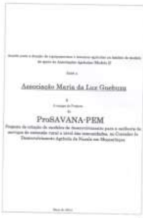
[左] 契約書表紙。訳：2014 年 5 月付、PEM モデル 2「アソシエーションによる農業支援モデル」のための農業資機材・投入財の寄贈契約 PEM チームと「マリア・ダ・ルス・ゲブーザ・アソシエーション」（リバブエ郡イアパラ地区） [下] 現地 NGO が調査中に遭遇した PEM 担当日本人専門家