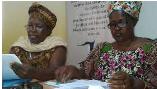
プレスリリース（マプト、2014 年 6 月 2 日） 「プロサバンナにノー！ 全国キャンペーン」【日本語訳】

2013年5月、20以上の市民社会組織、社会運動、小農組織、環境および宗教組織、並びにナカラ開発回廊の家族・コミュニティは、モザンビークおよびブラジルの大統領と日本の首相宛の「プロサバンナ事業の緊急停止と再考を求める公開書簡」に署名し、提出した。