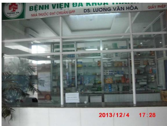
[写真 23: 院内薬局]