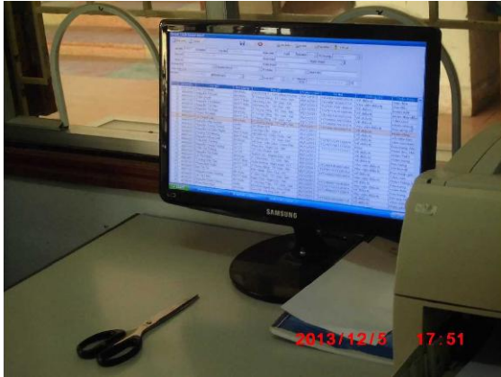
[写真 34: 受付内のシステムの画面]