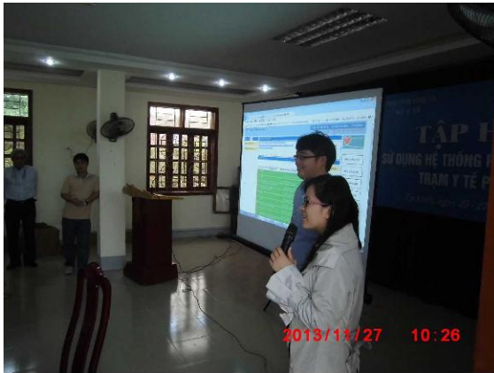
[写真 5:Mame-NET 研修担当と通訳]