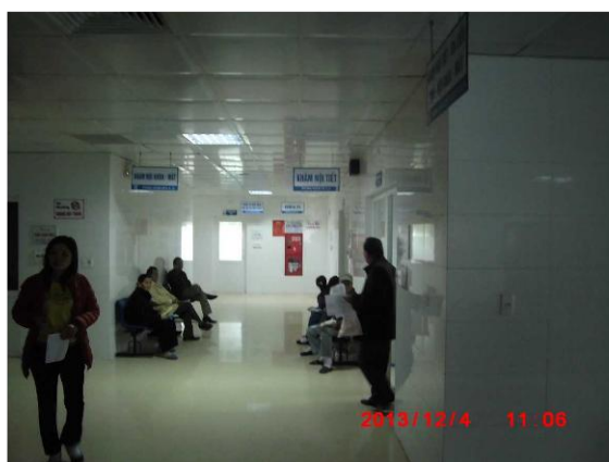
[写真 12: 患者の待合場所 2]