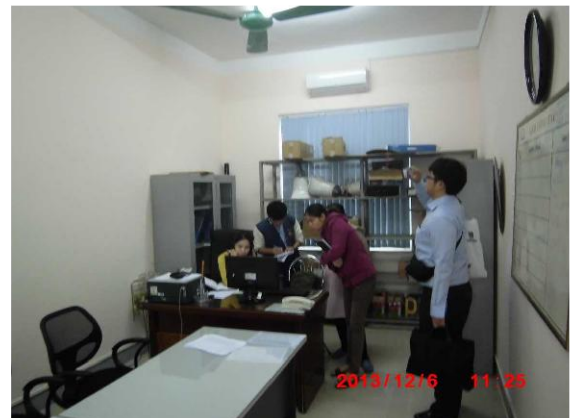
[写真 39: ヘルスセンター内で個別指導中]