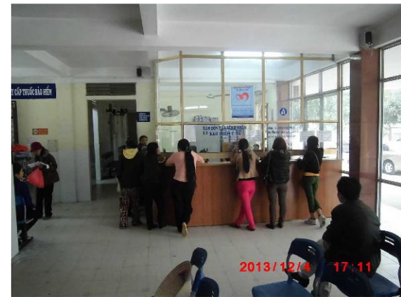
[写真 19: 受付の様子]