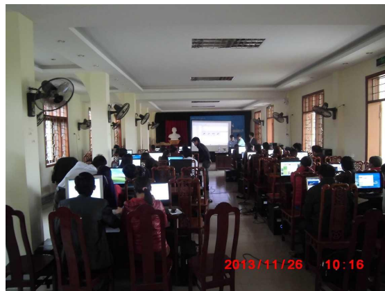
[写真 3:研修の様子 2]