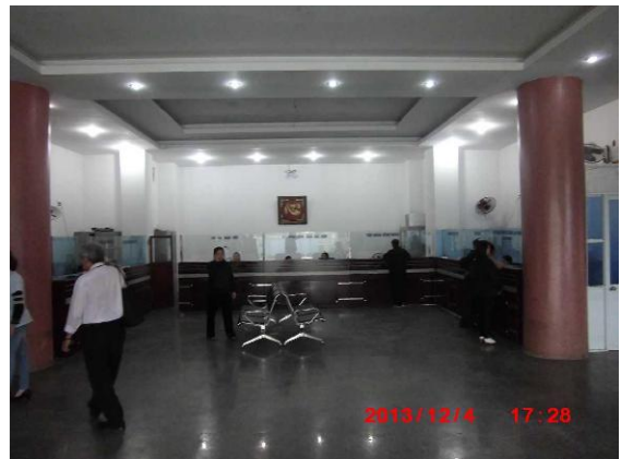
[写真 22: 病院受付]