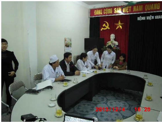
[写真 16: 院長と副委員長（左から2人目と4人目）