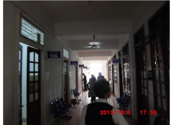
[写真 35: 院内の様子]