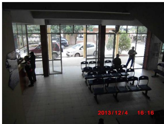
[写真 15: 待合室の様子]