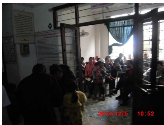
[写真 28: 待合室の様子]