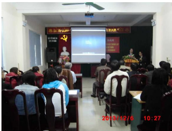
[写真 36:ヘルスセンター ダー局長挨拶]

今回の実証実験でキーマンとなる、ヘルスセンターの担当各課（7 課）の利用者に研修を実施した。研修担当は高梨、通訳（クイン）で実施。