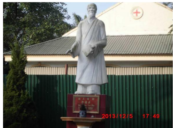
[写真 33: 昔の医師の記念碑]