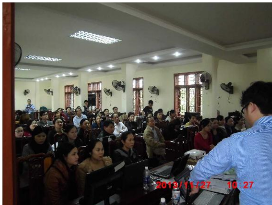
[写真 7:Mame-NET 研修聴講者]