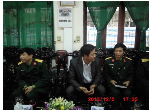
[写真 31: 左の方が病院長]