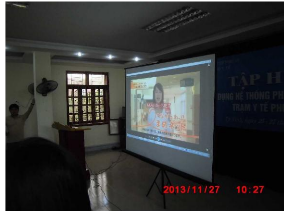
[写真 6:Mame-NET 紹介動画]