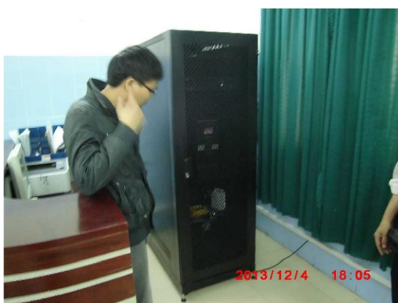
[写真 25: 病院内のラック]