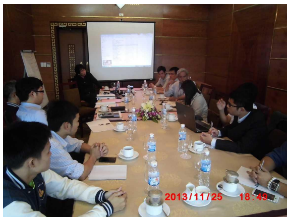
[写真 1:研修準備の打合せ様子]