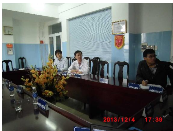
[写真 24: 院長と IT スタッフ]