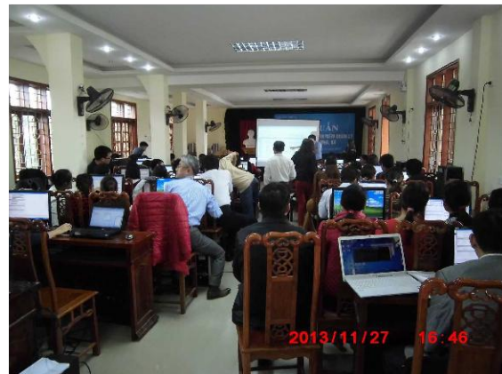
[写真 8:Mame-NET 研修指導の様子]