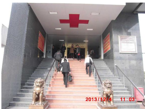
[写真 10:病院入口撮影]