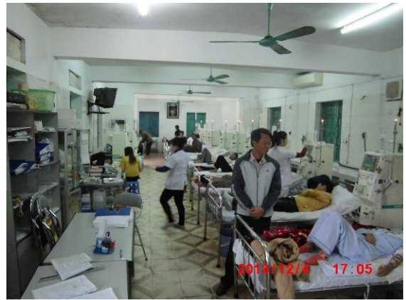
[写真 17: 多数の人口透析装置]