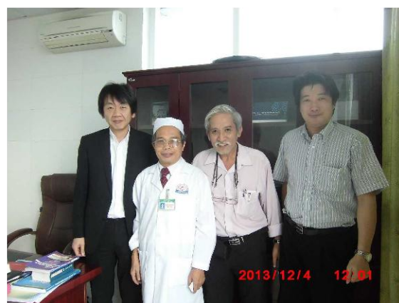
[写真 13:副院長と撮影]