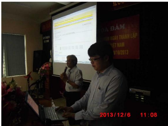
[写真 38:ヘルスセンター 研修の様子]