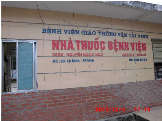
[写真 20: 病院表札]