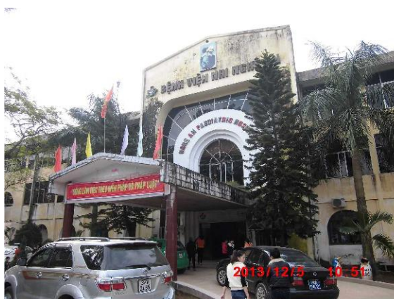
[写真 27: 病院の入口]