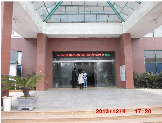
[写真 21: 病院入口]