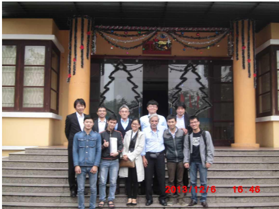
[写真 40:プロジェクトメンバーで撮影]

Mame-NET 導入説明のため、病院訪問をしたが、約束の時間になっても院長、他担当医師との面談は実現しなかった。当日は病院の重要な会議があり、それに時間を要しているとのことであった。調査時間の制約があり、今回訪問は中止し、以降の対応をリンクス社へ一任することとした。