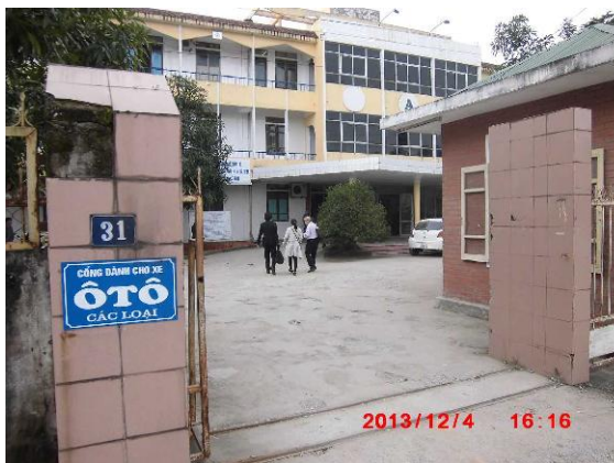
[写真 14:病院入口撮影]