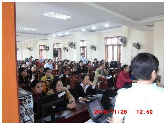
[写真 2:研修の様子 1]