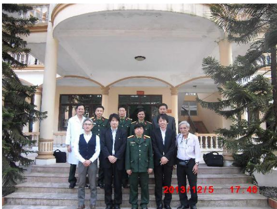
[写真 32: 病院玄関前で撮影]