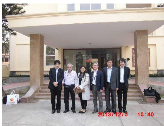
[写真 26: 病院前で撮影]