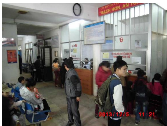
[写真 29: 受付の様子]