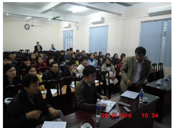
[写真 37: 研修参加者]