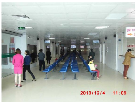
[写真 11: 患者の待合場所 1]