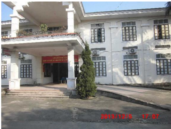
[写真 30: 診察棟入口]