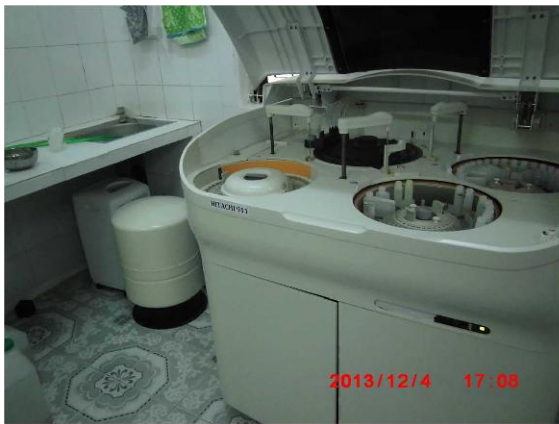
[写真 18: 検査機器（ほとんどが日本製）]