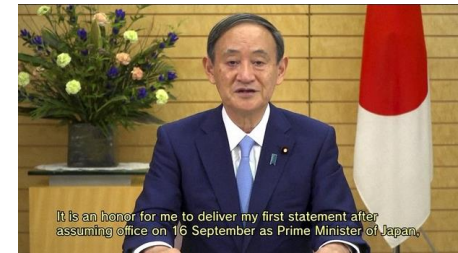
It is an honor for me to deliver my first statement after assuming office on 16 September as Prime Minister of Japan.