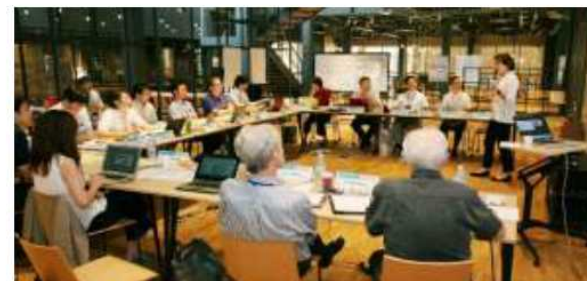
チャレンジラボ：扇が丘キャンパス