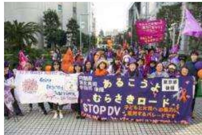
▼市民団体による女性支援活動への助成金

透明性と説明責任 : 生産者と消費者が産地で生産状況を確認する「公開確認会」を実施、定期的な情報発信。