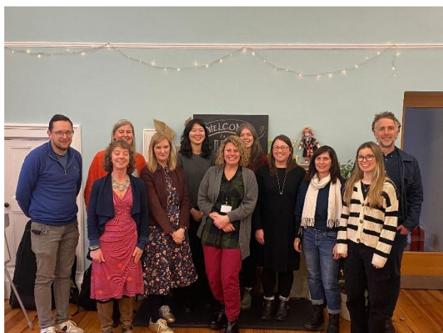
IDEA のスタッフと加盟団体のみなさん