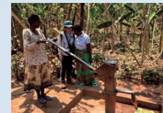
井戸修理が無事に完了し、村長と喜ぶ筆者（写真左から2人目）

「水の防衛隊」は、地域住民の安全な水へのアクセス確保に向けて、これまで井戸や湧水の維持管理などに取り組んできました。私は先輩隊員の活動を引き継ぎ、ルワンダの水衛生公社と連携して、井戸のパーツを首都から地方の村へ届ける仕組み作りを進めています。初めて出会った住民から、笑顔で「JICA！」と声をかけられる度に、長年にわたるJICA海外協力隊の成果が信頼という形で現場に息づいていることを実感します。60周年を迎えた今、協力隊のこれまでの歩みを真摯に振り返り、より地域の実情に沿った支援の在り方を考えていきたいです。