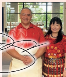
深川氏と筆者（写真左）