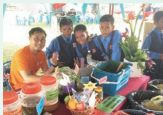
マレーシアにて、環境教育隊員として環境啓発ワークショップに取り組む社員の様子

JICA海外協力隊発足60周年、心より祝い申し上げます。当社は、2013年度からJICA海外協力隊連携派遣制度を活用し、これまでに累計19名の社員を協力隊員として各国に派遣してきました。派遣された社員は、現地での活動を通じ、文化や商習慣の違いを越えて自発的なリーダーシップを培い、その学びをいかして帰国後も活躍しています。社会課題に向き合うマインドの醸成、および日本企業のグローバルな事業推進を担う「人材育成」に寄与する協力隊事業を長年支えてきた皆様に、心より敬意を表すとともに、世界と日本の未来を切り拓くJICA海外協力隊事業の今後のさらなる発展を期待しています。