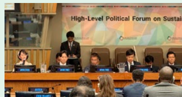
HLPF 閣僚級会合における日本代表团

（気候変動）等で進展が確認できる一方、目標5（ジェンダー）、目標10（不平等）等では課題があることを確認しました。