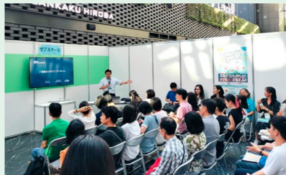
参加者で賑わうサブステージの様子