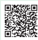
鷹の爪団の 行け！ ODA マン