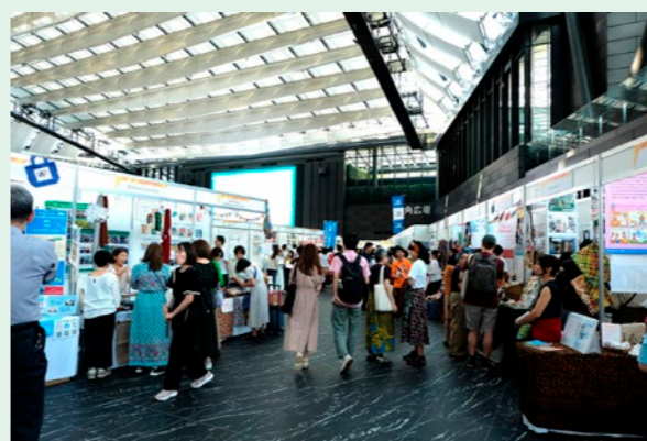
駐日大使館、国際機関やNGO等の出展が行われた会場の様子。外務省も出展し、世界で役立つ日本のODAをわかりやすく伝えた。

日本と世界の平和と安定、そして繁栄のために、日本が取り組むODAに参画する企業は、全国各地に広がっています。積極的に世界に貢献する日本の中小企業にインタビューを行い、事業参画までの経緯や成果、ODAへの思いなどを語っていただいた記事を、都道府県別にホームページに掲載しています。ODA事業に参画することで、多くの中小企業の皆様が現地におけるビジネスモデルを構築し、現地政府機関等からの信頼を獲得し、知名度向上やパートナーの拡大、金融機関からの信用力向上、さらなる海外展開へとつなげています。