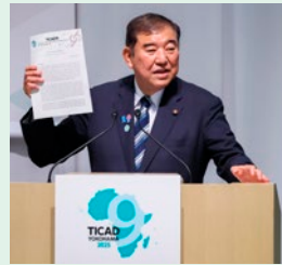
石破総理大臣（当時）が閉会式で成果文書を採択する様子

加えて、TICAD 9では、日本企業のアフリカに対する関心の高まりを背景に、ビジネス関連の議論や交流も活発に行われました。21日に開かれた官民ビジネス対話では、アフリカにおける「経済多角化」、「地域内統合・連結性および域外連結性」、「ファイナンス強化」をテーマに、自由闊 か 達な議論が展開されました。また、日本とアフリカの官民間で、前回