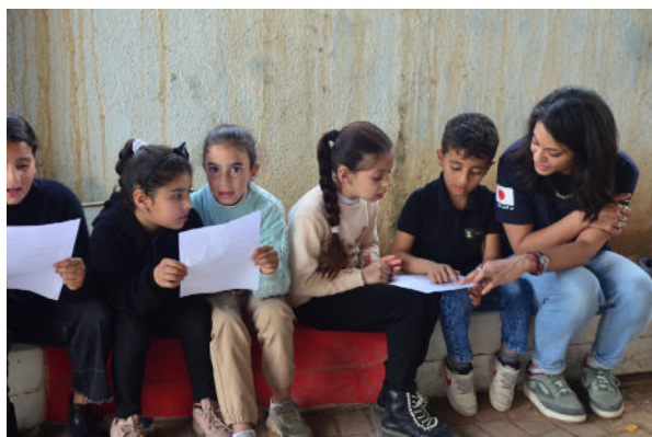
パレスチナのジフトリック村において、こどもたちへの指導方法の研修を受けた若者たちによる活動の様子

岩屋外務大臣（当時）は、2025年9月に開催された国連パレスチナ難民救済事業機関（UNRWA）支援閣僚級会合に出席し、パレスチナ難民を支えるかけがえのない柱であるUNRWAに対し日本は70年以上にわたる支援をしてきていると述べ、UNRWAのガバナンス改善に向けた取組を後押しするとともに、国際社会と緊密に連携し、UNRWAの活動を支え、パレスチナ難民支援に全力で取り組む決意を表明しました。