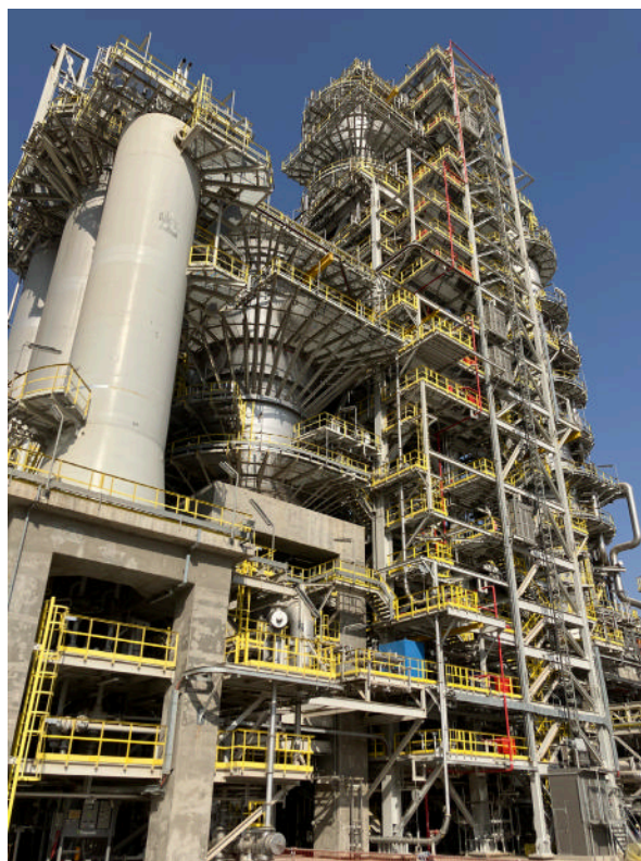
イラクに対する円借款「バスラ製油所改良計画」にて完成したプラント

ヨルダンには、治安が不安定な国や地域に囲まれ、特に昨今は中東地域全体の不安定化および周辺国の情勢悪化等に伴うテロの危険性の高まりや国境を越えた犯罪増加などが懸念されています。このため、ヨルダンの国境管理強化は喫緊の課題となっています。2025年9月、日本は、ヨルダンに対し、日本製の治安対策機材などの供与を決定しました。また、日本は「日・ヨルダン・パートナーシップ・プログラム」に基づ