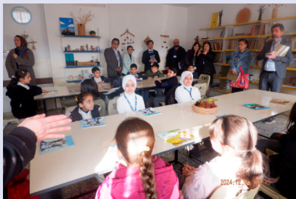
小学校図書室における生徒の親や日系企業関係者による授業の参観

さらに、同校では、現地の日系企業と連携し、落成式や授業参観に企業関係者を招いて交流を深めたほか、図書室の寄贈や図書室の整備、生徒による日系企業の見学など、日本的な要素を取り入れながら多角的な支援を継続しています。こうした日系企業との交流や、生徒の主体性を高める日本式の教育は、生徒の学習意欲向上のみならず、イラクにおける親日感情の醸成にもつながっています。