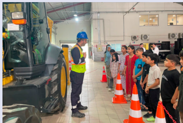
日系企業での会社見学で建設機械についてオペレーターから説明を聞く生徒たち