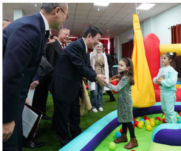
茂木外務大臣によるジャラゾン難民キャンプ視察