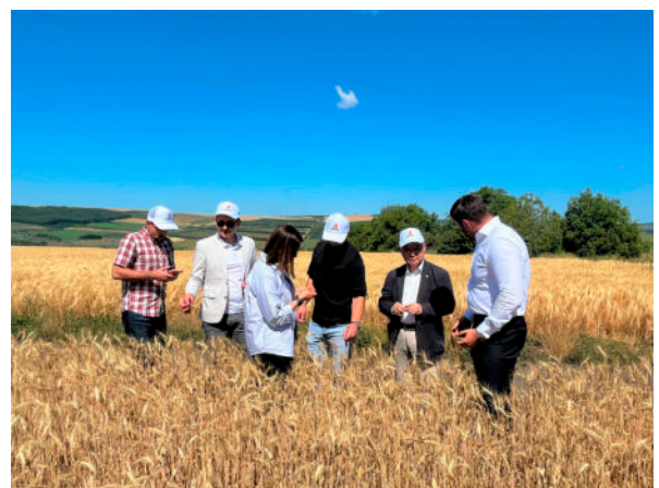
日本政府の支援によって裨益した若手農家によるモルドバの小麦畑

ロシアによるウクライナ侵略の長期化により、周辺国への負荷も長期化しています。日本は、周辺国の負担を軽減し、ウクライナへの人道支援、復旧・復興支援を効果的に行う観点から、周辺国に対しても支援を行っています。