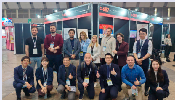
東京都が主催するアジア最大級のスタートアップに関する国際会議「Sustainable High City Tech Tokyo 2025」に参加したセルビアのスタートアップ