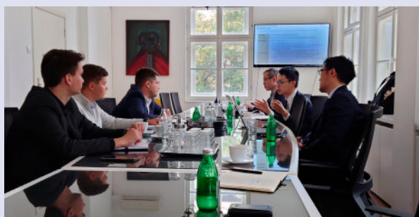
科学・技術開発・イノベーション省とJICA専門家の協議の様子

本件の関係者からは、「セルビアのスタートアップは、Project NINJAを通じて、海外展開戦略を練り、日本やシンガポールとのネットワークを築く好機を得ました。さらに、日本とシンガポールで生まれたイノベーションは偶然ではなく、共同ビジョンと知識への投資の結果と知ることができました。」との声が聞かれています。日本は、今後もProject NINJAを全世界に展開していくことで、各国において質の高い雇用創出の契機となるスタートアップの成長を促進し、ビジネスを通じて途上国の社会課題の解決を図ります。