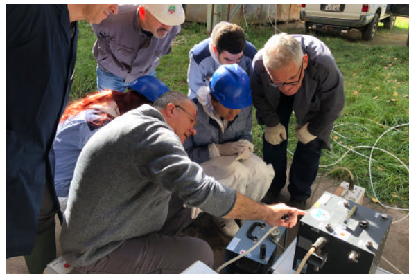
コソボにおける大気汚染対策政策につなげるためのモニタリングの様子

セルビアについては、2024年に完工したニコラ・テスラ火力発電所排煙脱硫装置を始めとして、石炭から再生可能エネルギーへの移行期にあるセルビアにおける脱炭素化に向けた努力を引き続き支援していきます（セルビアにおけるスタートアップ支援については、117ページの「案件紹介」参照）。