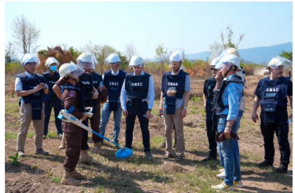
ウクライナ視察団によるカンボジアの地雷除去現場視察の様子

日本は、引き続きG7を始めとする国際社会と連携しながら、困難に直面するウクライナの人々に寄り添った支援を実施していきます。