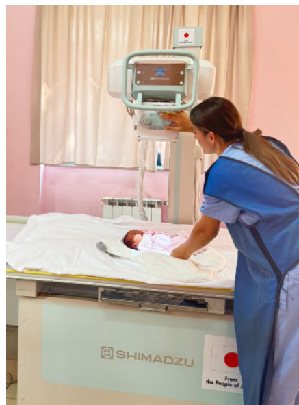
アルバニアにおいて、草の根・人間の安全保障無償資金協力で供与されたデジタルX線撮影装置により新生児の診断をする様子

また、日本はボスニア・ヘルツェゴビナの将来を担う人材の育成のための支援も行っています。例えば、近年では、ボスニア・ヘルツェゴビナの人々の生活の質向上を目指した医療・保健体制強化支援、EU加盟プロセスの進展に必要な不可欠な国境管理能力強化支援、防災・減災に係る知見共有などを実施しています。