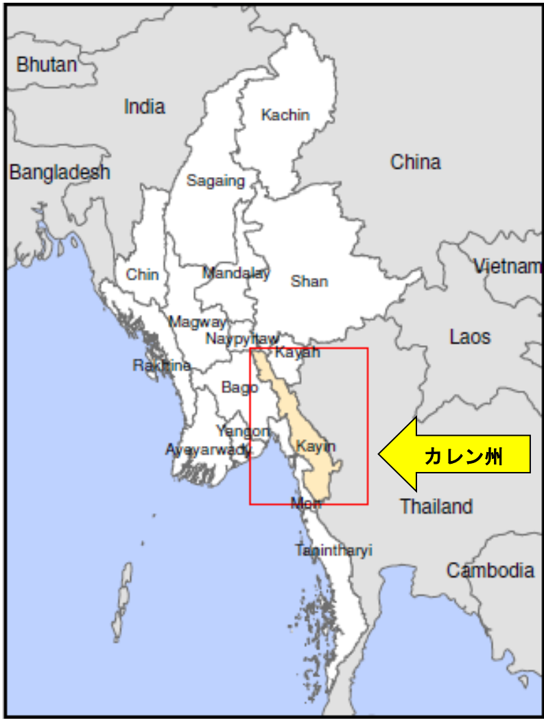
事業地地図 1：ミャンマーカレン州の地図