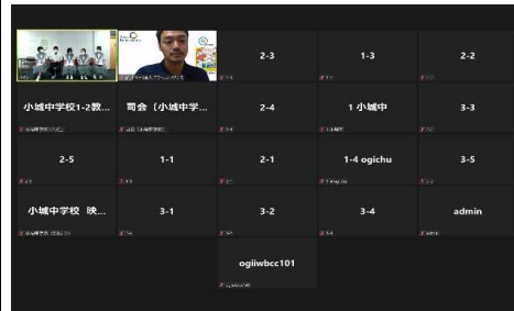
オンライン配信の様子、プライバシーのため、各教室の映像はオフで行った