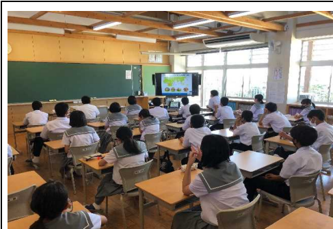
授業の様子。各クラスから視聴をした。