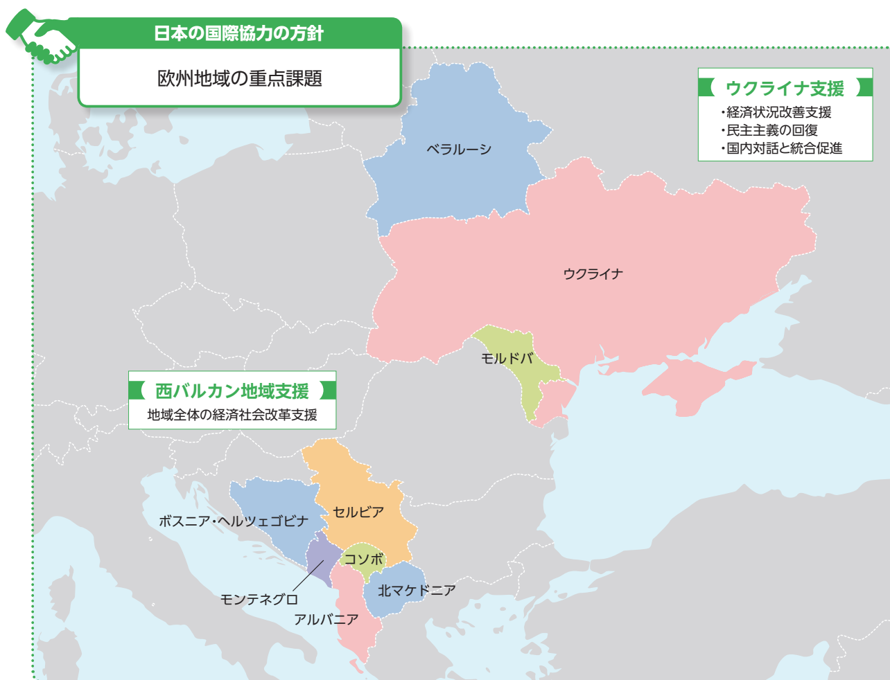
図表Ⅲ-6 欧州地域における日本の援助実績