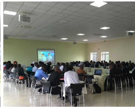
ルワンダでのイベントにて上映