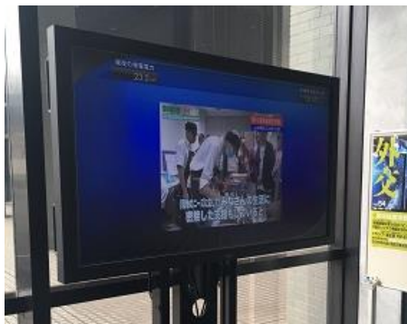
外務省東口玄関にて上映