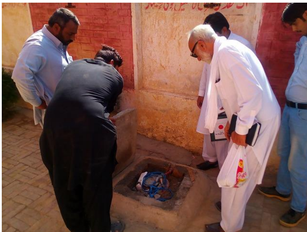
設置が完了した井戸の状態を確認する井戸および浄水システム専門家（右）。本校では 195 フィート（約 59 メートル）まで掘削した。(パキスタン公立女子小学校 GGPS Kag No. 1、2016年10月17日撮影)