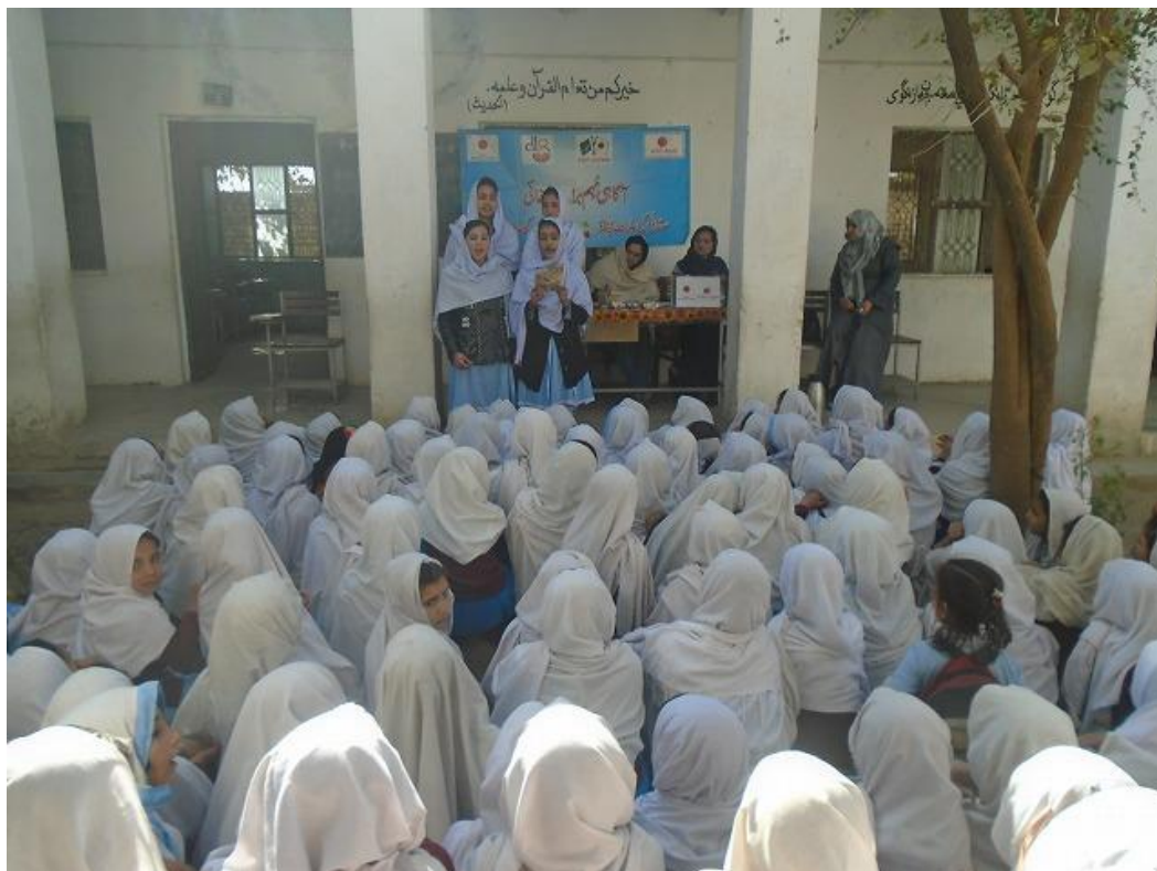
衛生に関する校内イベントの様子。各学年から選ばれた代表児童が、全校児童の前で習得した衛生の知識を競った。（アフガニスタン難民居住地域内女子小学校 PSG 293、2016年12月20日撮影）