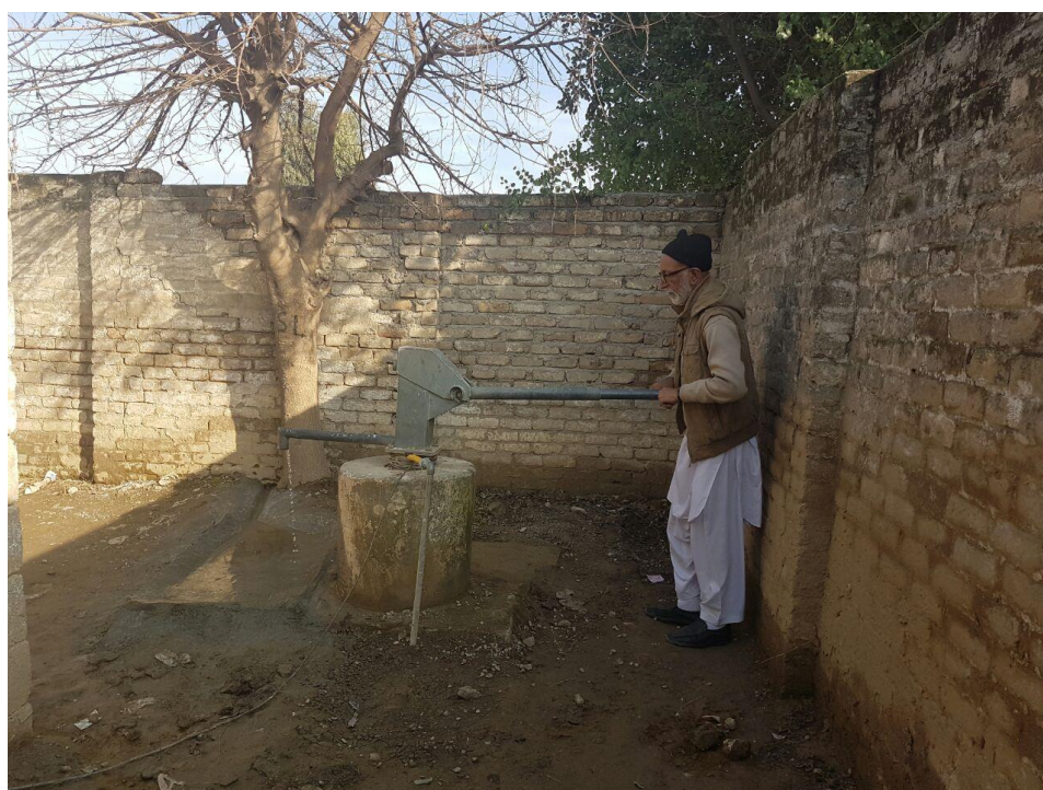
既存のハンドポンプ式井戸に水中モーターポンプを取り付け、電動でも取水できるよう改造した井戸。写真は水の状態を確認する井戸および浄水システム専門家。(アフガニスタン難民居住地域内女子小学校 PSG 282、2017年1月31日撮影)