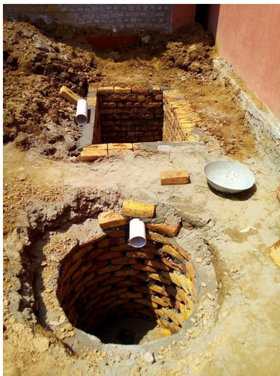
浸出槽（手前）と浄化槽（奥）の設置の様子。上水の汚染を防ぐため、浸出槽や浄化槽は近隣の井戸と距離をとって設置した。（パキスタン公立女子小学校 GGPS Kalu Pind、2016年8月14日撮影）