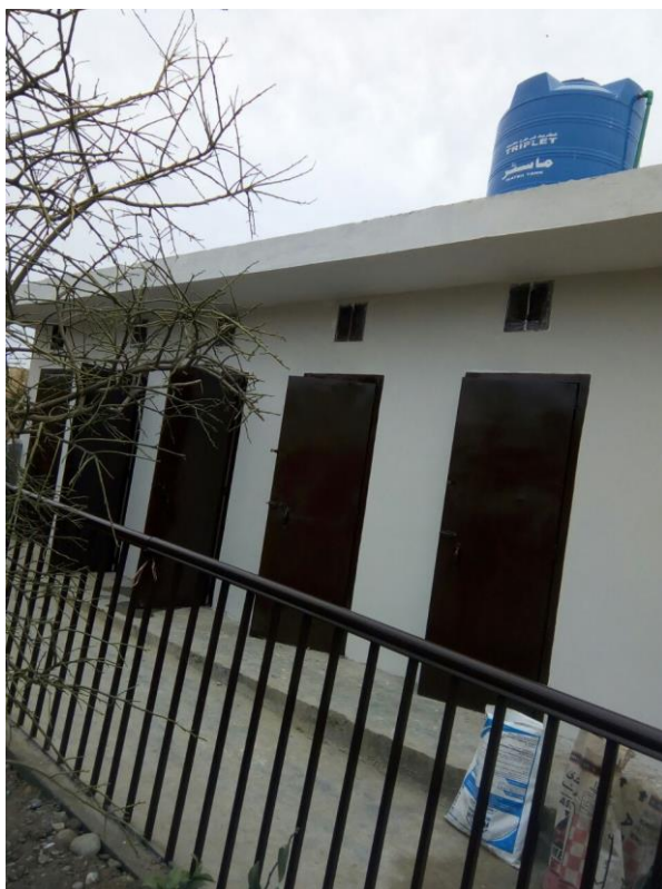
トイレの工事が完了した女子小学校。本校のトイレは老朽化が進み、水も不足していたため、使用できない状態であった。工事によって児童が安心してトイレを使えるようになった。（アフガニスタン難民居住地域内女子小学校 PSG 267、2017年2月2日撮影）