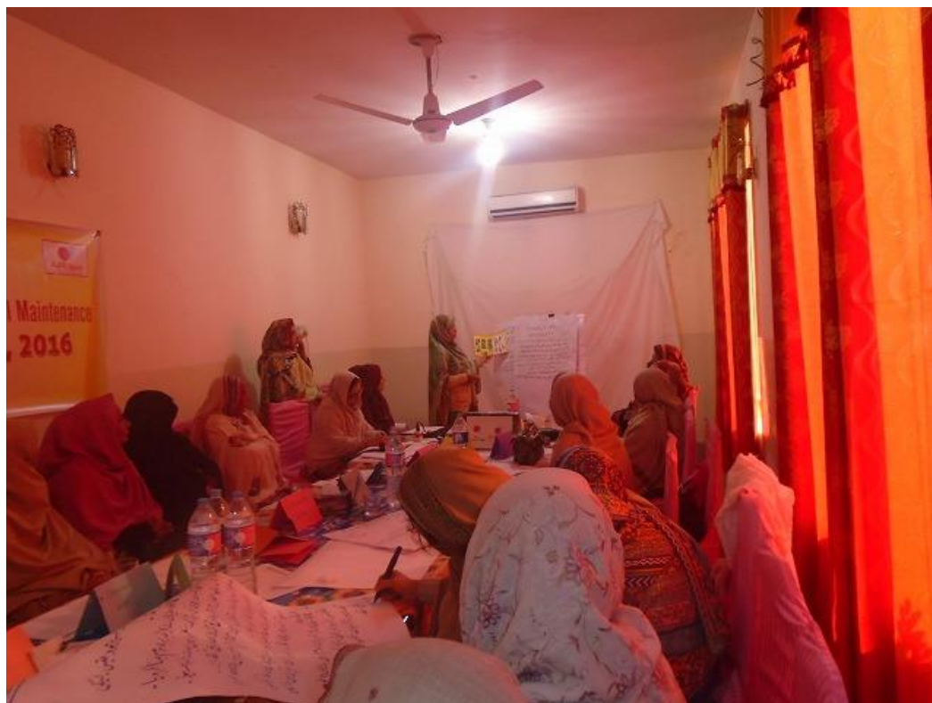
教育関係者間の情報共有セミナーでは、ハイバル・パフトゥンハー州ノウシェラ郡の教育局関係者や教師が、ハリプール郡の教育関係者に対し、学校維持管理のノウハウについて共有した。(ハリプール郡、 2016 年 12 月 29 日撮影)