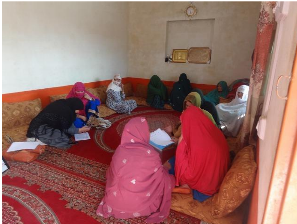
学校設備が中・長期的に適切に維持されることを目的とした、維持管理に関する第 2 回目の会合の様子。 第 1 回目で話し合った内容が計画通りに進んでいるかを振り返った。(アフガニスタン難民居住地域内 女子小学校 PSG 267、2016 年 11 月 14 日撮影)