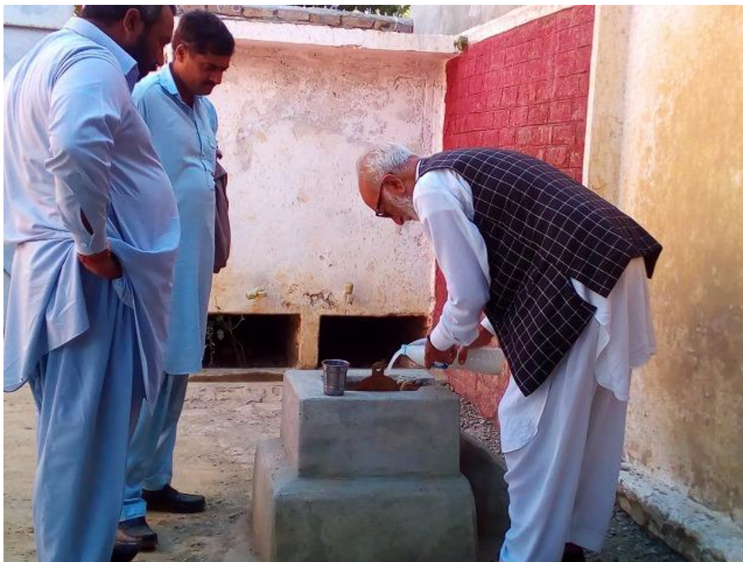
水質検査の結果、掘削した井戸水に大腸菌群が検出されたため、塩素処理を行う井戸および浄水システム専門家。処理後の水質検査では、大腸菌群が検出されなくなったことを確認した。(パキスタン公立女子小学校 GGPS Sari、2016年11月7日撮影)