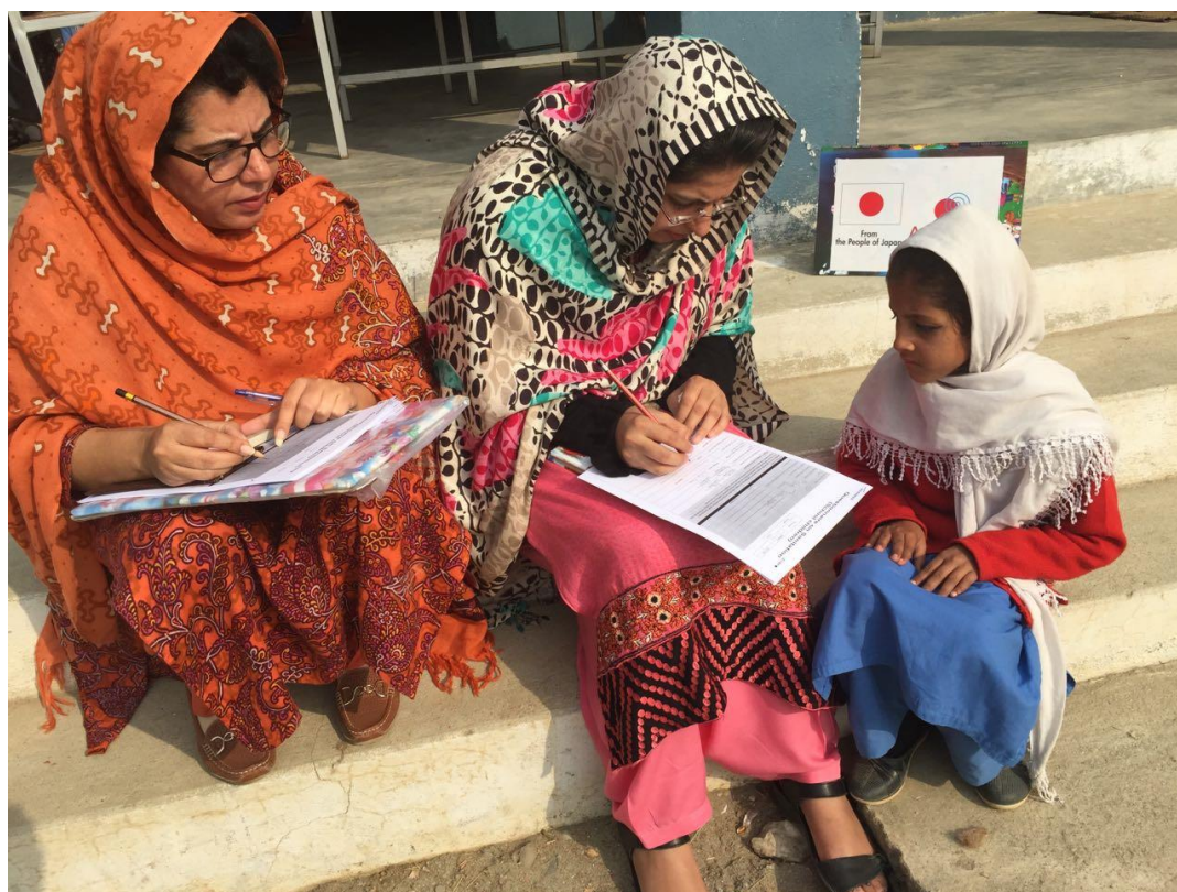
事業実施後、児童の衛生に対する理解度や知識の定着を確認するために実施した知識調査の様子。中央は当会スタッフ、左は現地提携団体（DLG）のスタッフ。（パキスタン公立女子小学校 GGPS Simlan Nagar、2016年11月25日撮影）