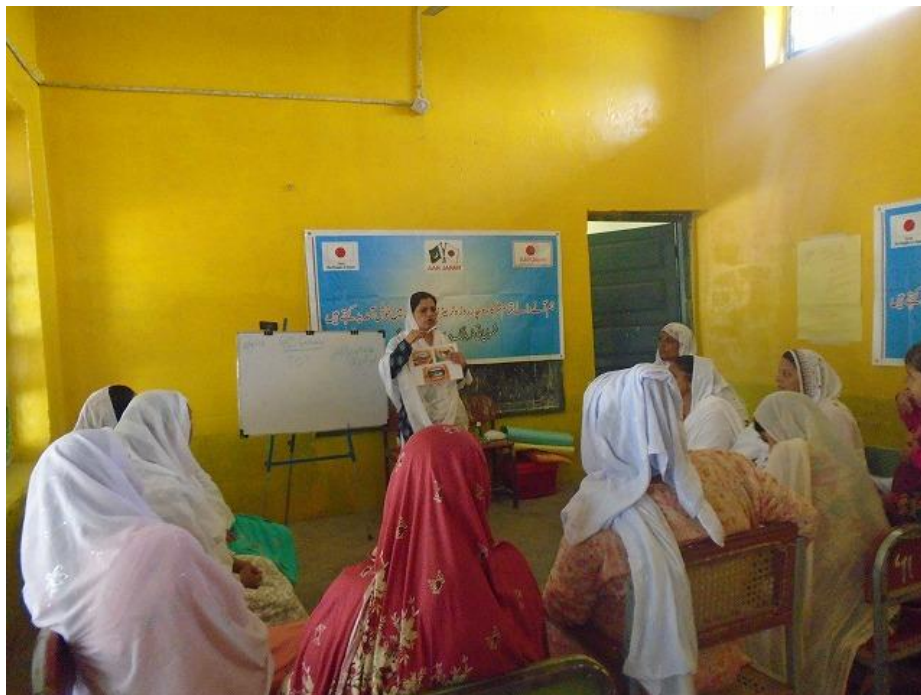
教師や保護者に対する指導者向け研修（TOT）1日目の様子。当会スタッフが、歯磨きの指導法についてデモンストレーションを行った。（パキスタン公立女子小学校 GGPS Gadwalian No.1、2016年8月2日撮影）