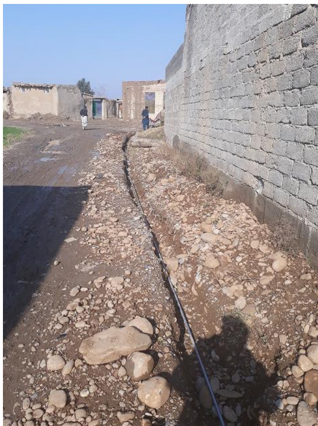
地盤が固く井戸掘削が困難であったため、近隣のコミュニティにある管井戸からパイプで学校まで配水する工事を行った。(アフガニスタン難民居住地域内女子小学校 PSG 082、2016年11月9日撮影)