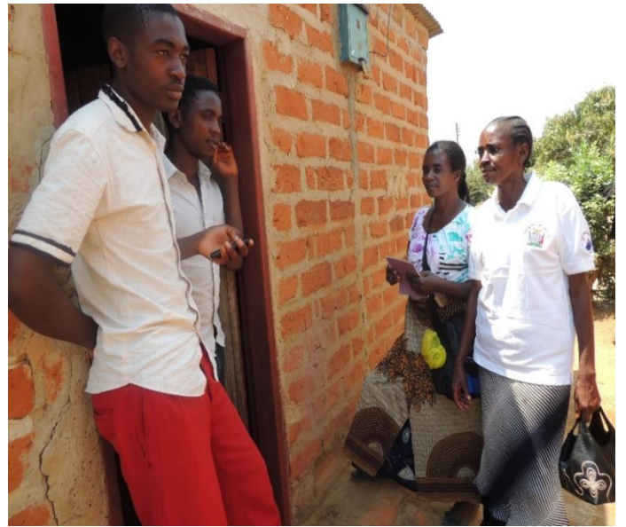
TSによる啓発活動（家庭訪問）