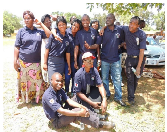
世界 HIV Day に参加した TS メンバー