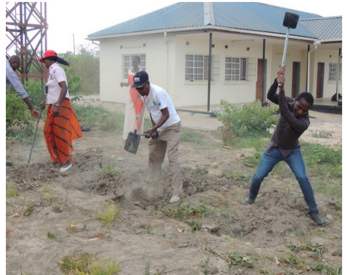
TSの所得向上を目的とした家庭菜園講習