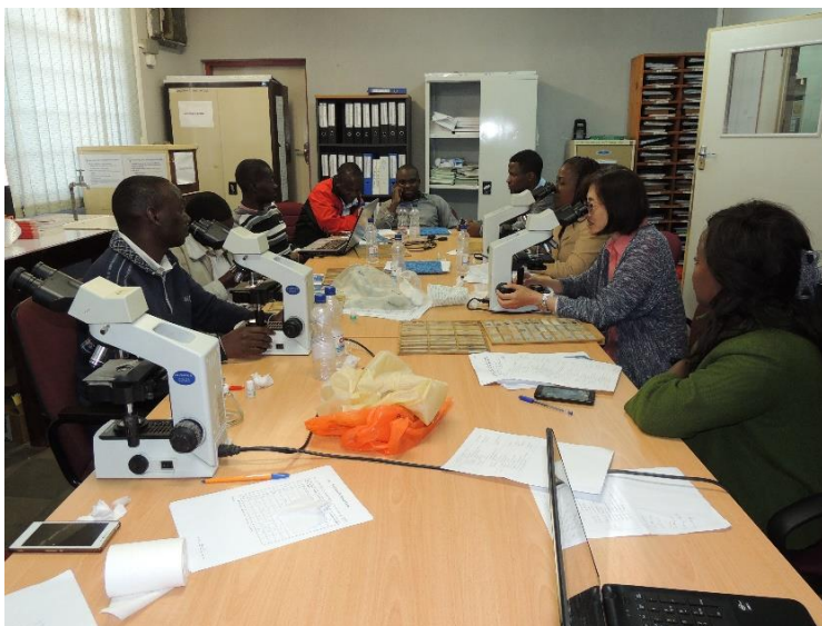
成田専門家による臨床検査技師への研修