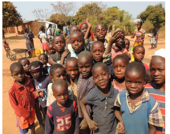
Chongwe での啓発に集まった子どもたち