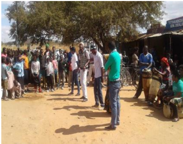
TSによる村落での啓発活動 (TB/HIVに関する寸劇)