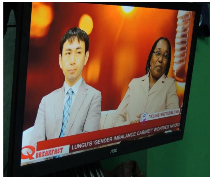
QF M テレビへの出演（平尾専門家、Vainess）