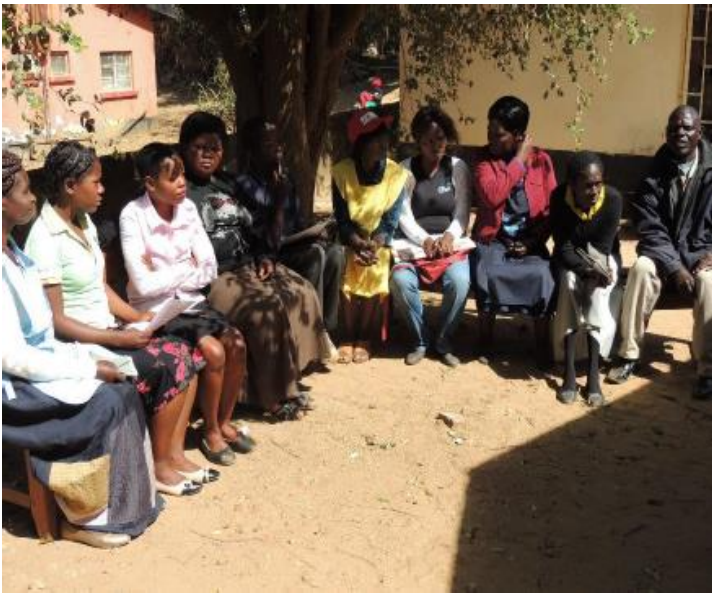
TS Meeting / Health center team