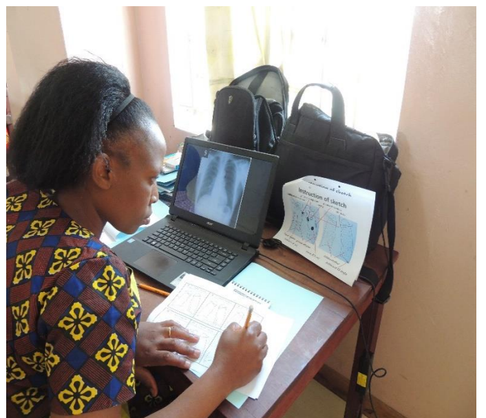
胸部 X 線読影研修での PRE Test Post Test 研修生各 1 名が 1 台のパソコンを使用