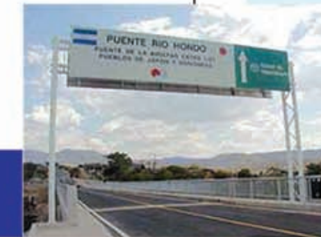
Puente "Río Hondo" Construido en el año 2003