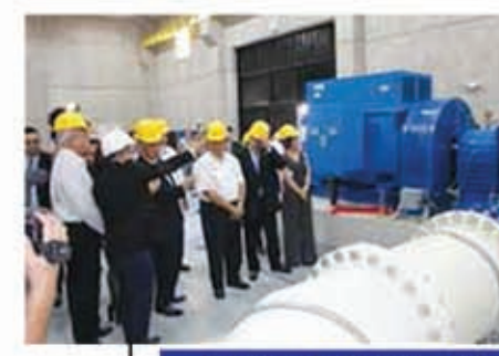
Proyecto de Generación de Energía Micro – Hidroeléctrica en el área metropolitana de Tegucigalpa