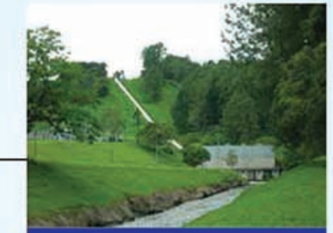
Central Hidroeléctrica Cañaveral