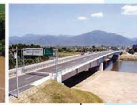
Proyecto de Restauración del Puente La Democracia Cooperación Financiera No Reembolsable