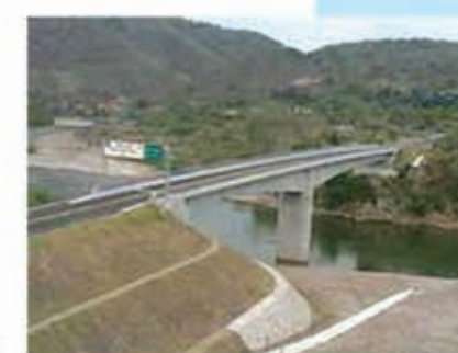
Puente "Ilama" Construido en el año 2003