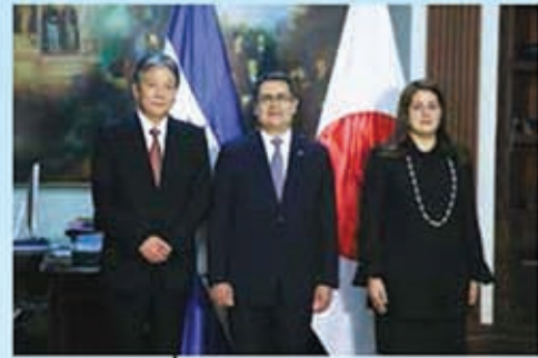
Inicio de relaciones bilaterales entre Honduras y el Japón