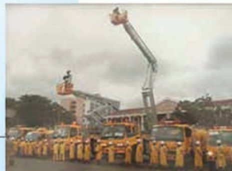
Proyecto de Equipamiento de Estaciones y Sub-Estaciones del Cuerpo de Bomberos de Honduras (30 vehículos)