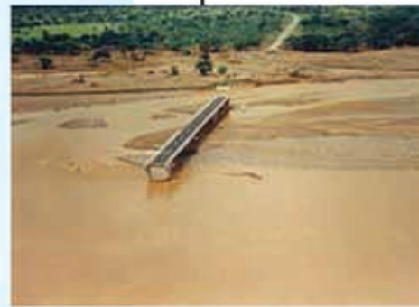
Puente "Sol Naciente" después del Huracán Mitch