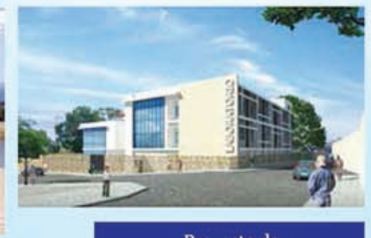
Proyecto de Construcción del Laboratorio Nacional de Vigilancia de la Salud