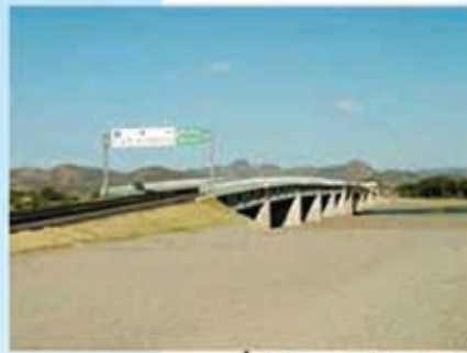
Puente "Sol Naciente" antes del Huracán Mitch