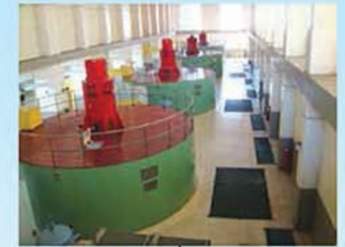
Proyecto de Fortalecimiento de la Hidroeléctrica Cañaveral – Río Lindo