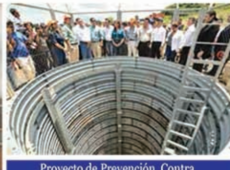
Proyecto de Prevención Contra Deslizamientos de Tierra en el área metropolitana de Tegucigalpa Cooperación Financiera No Reembolsable