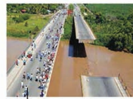
Puente "La Democracia" Construido en el año 2003.