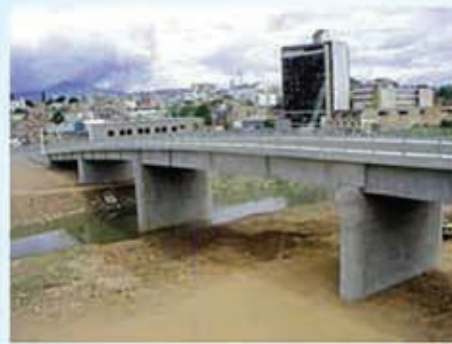
Puente "El Chile" Construido en el año 2003