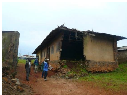
老朽化した既存校舎