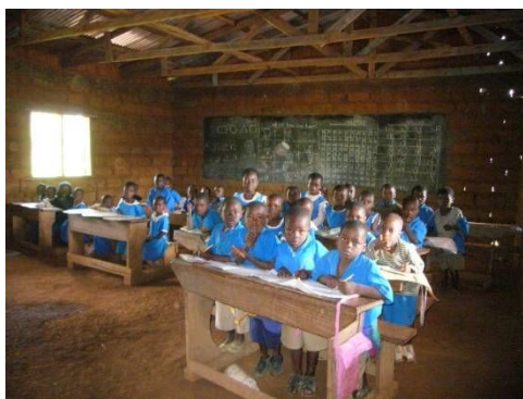
過密状態で授業を受ける児童