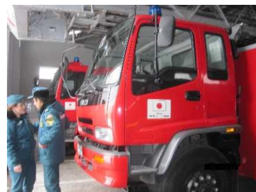
アルメニア 「エレバン市消防機材整備計画」 日本が供与した消防車