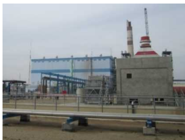
アゼルバイジャン 「シマルガス・火力複合発電所 第 2 号機建設計画」建設現場

各国の個別の支援だけでなく、コーカサス諸国全体に共通する課題に対して 3 か国が一体となり取り組める支援体制の見直しが望まれる。