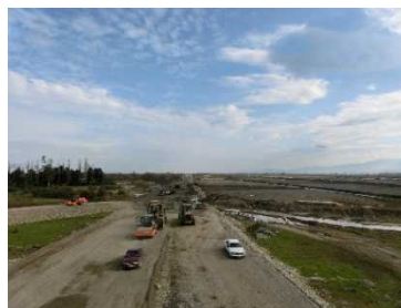
ジョージア 「東西ハイウェイ整備計画」 工事現場