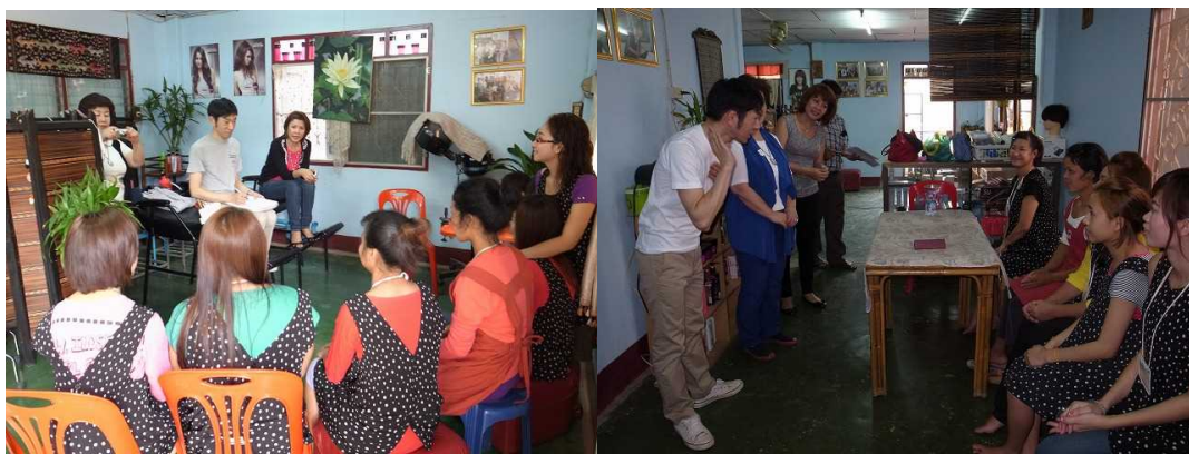
(上) 美容研修の模様（日本人専門家の技術研修）