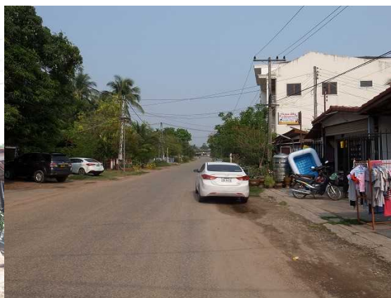
(右) 事務所兼就労ワークショップ (3階建中央)