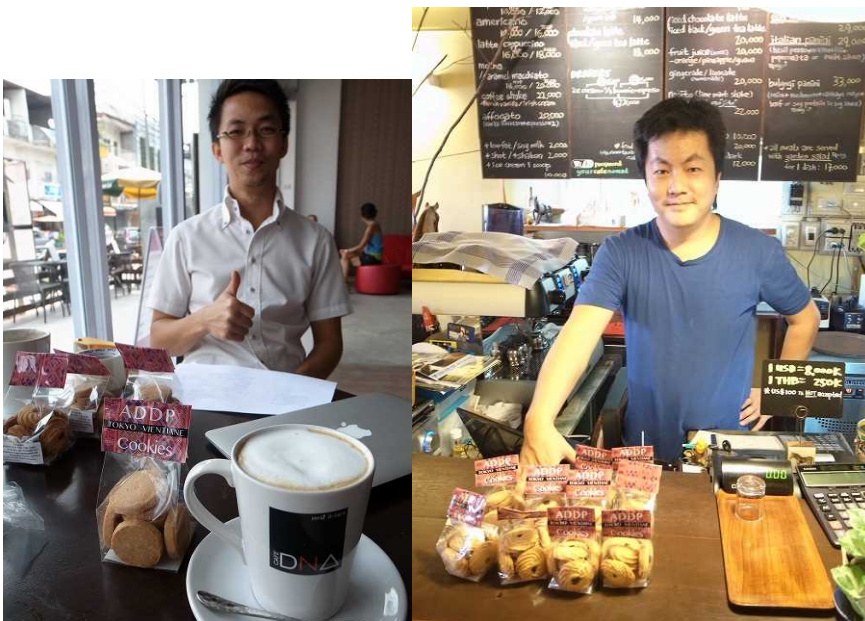
(上) 当会事業をサポートするビエンチャン地元のカフェ