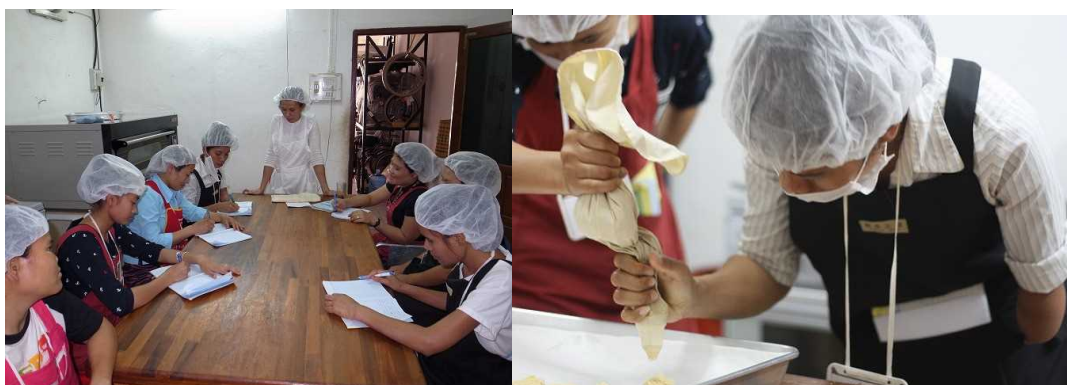
(上) クッキー研修の模様

過去 3 年の障害者職業技能研修（ベーカリー、美容及び車椅子）及びラオス地方における障害者就労啓発のための意見交換会の模様