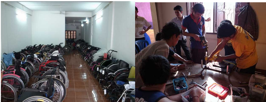
(上) 車椅子研修 (車椅子のメンテナンス実施)