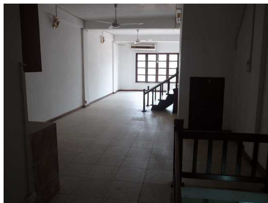
事務所及び IT 印刷研修スペース (2F)