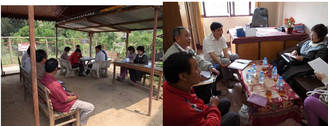
(上) ラオスの地方都市における障害者就労促進セミナーやラオス地方政府高官との意見交換会