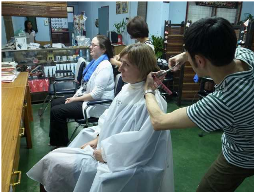
実際にお客様を迎えカットをするところを研修生に見せ学ばせる OJT スタイルの職業訓練