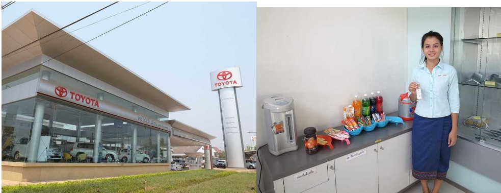
(上) CSR 促進企業先駆けとして当会事業を支援する日系企業。企業内のディーラー用販促