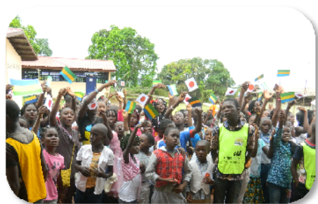
(Photo; l'École d'Application ENIF (École Normale d'Instituteurs Franceville))