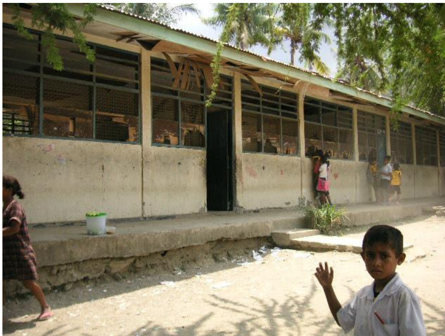
事業開始前のディリ県 マンレウワナ小中一貫校の様子。 校舎の屋根や壁が壊れて、児童が怪我をする可能性もある。 教室内も暗く、学習環境も悪い。