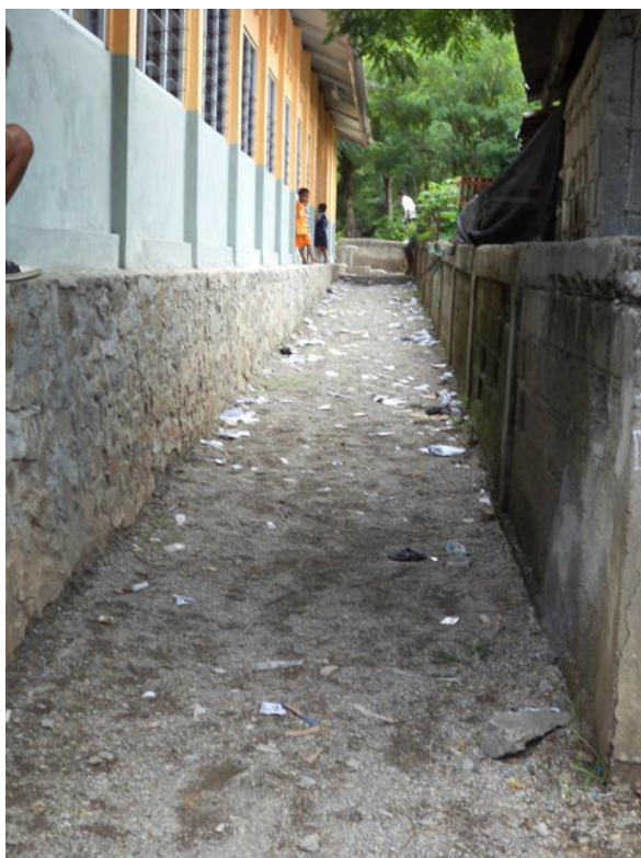
事業開始前のディリ県 マンレウワナ小中一貫校の校庭の様子。 校内のいたるところにこうしたごみが散らかり、清掃をする習慣がない。