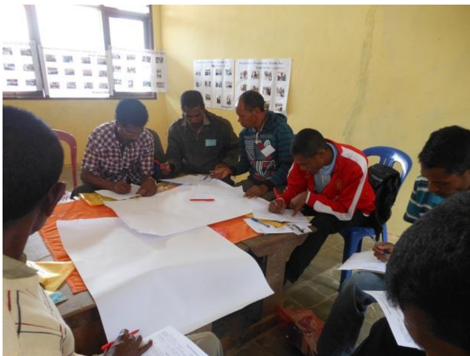
全事業で行った学校長対象ワークショップの様子。 自分の学校で行う、年間の学校保健活動を作成し、半年ごとに評価を行った。