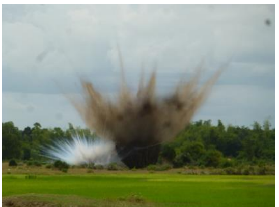
WP弾と一般弾薬の同時爆破