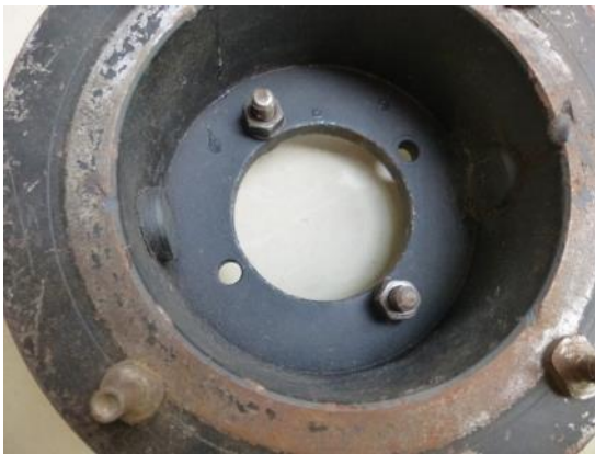
改良前（ボルト位置の調整不可能）