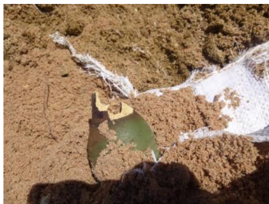
ディアマーで安全に破壊された信管