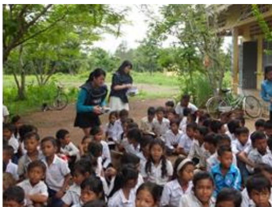
研修者による啓蒙ノートの配布