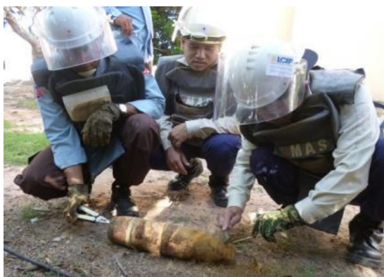
105mmWP発煙弾の識別要領