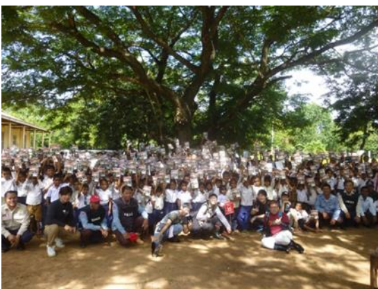
危険回避教育後の記念写真