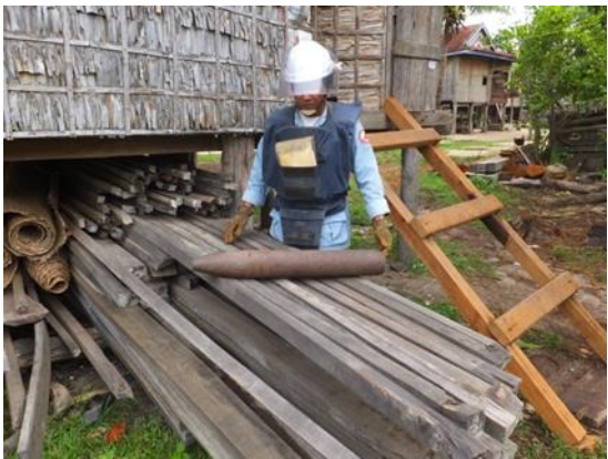
床下から回収されたロケット弾