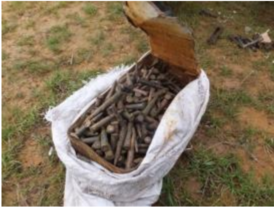
金属缶に入った銃弾