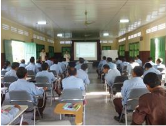
授業（学科）の実施状況