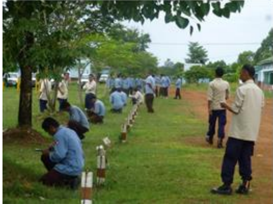
術科試験（識別）の状況