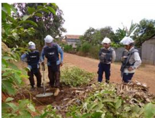
金属探知機による探査要領