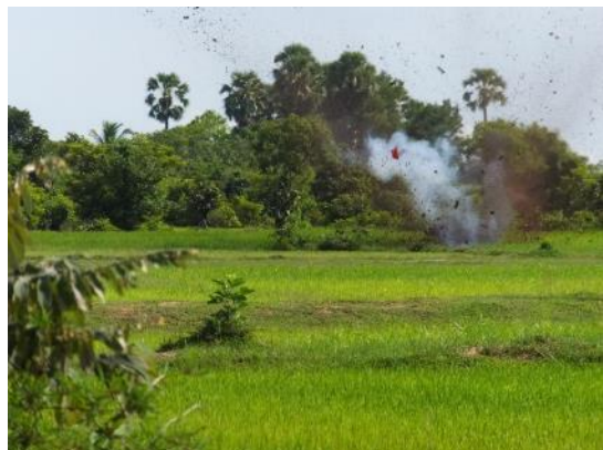
動かさない不発弾を水田で現地爆破