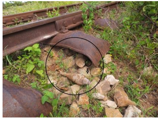
レールの枕材の下にあった不発弾