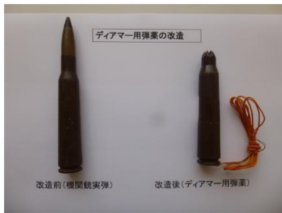
改造されたディアマー用弾薬