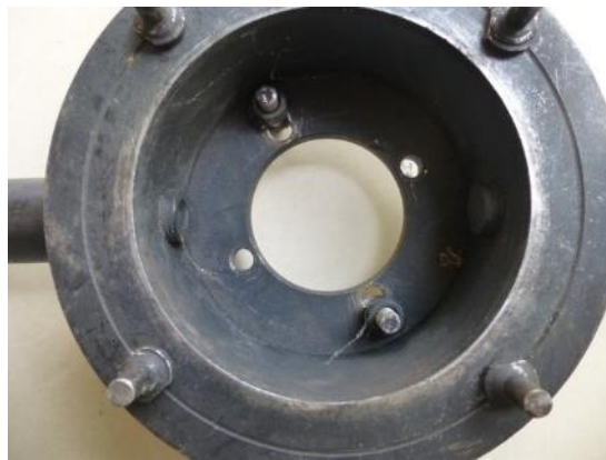
改良後（ボルト位置の調整可能）