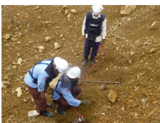
爆破薬の不発弾への添装要領