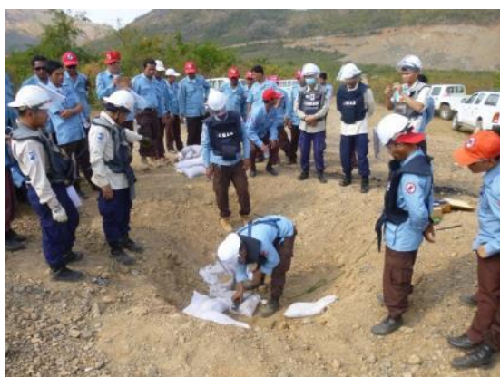
ディアマー使用要領の展示・実習