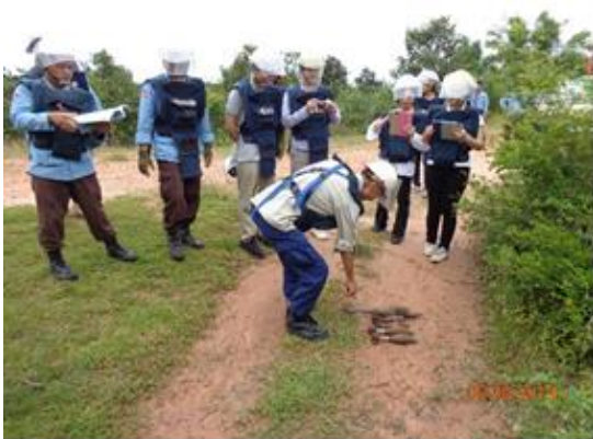
研修者に対して不発弾の説明