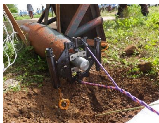
爆弾信管に装着されたロケットレンチ