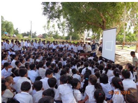
スクリーンを使つての教育