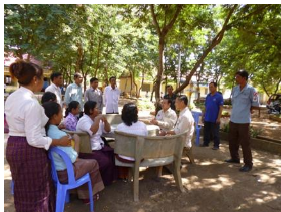
校長・教師との意見交換