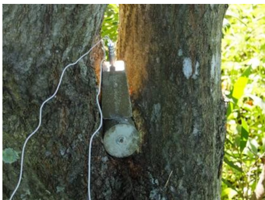
木から取り出せない不発弾を現地爆破