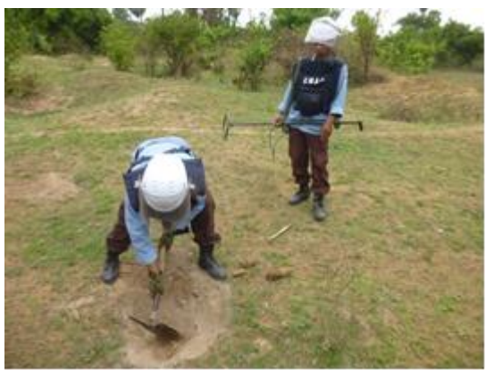
金属探知機で回収した不発弾