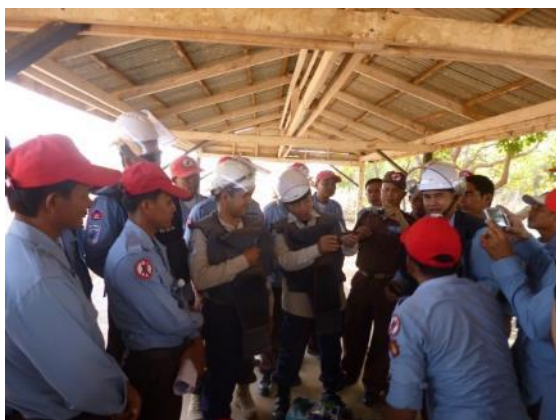
ディアマー用弾薬改造の展示・実習