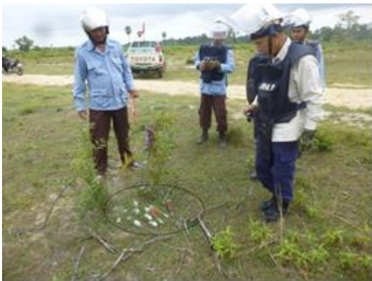
無造作に捨てられた12発の不発弾