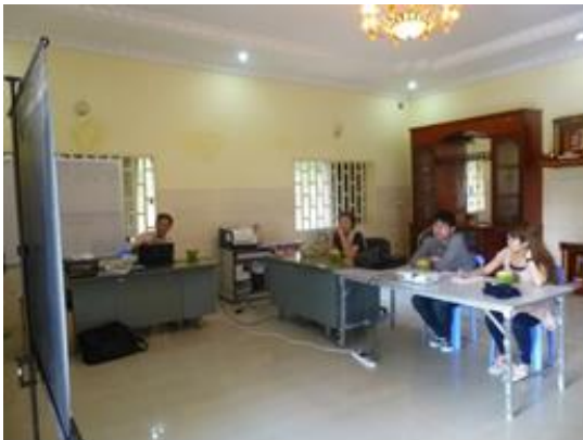
大使館視察（ブリーフィング）