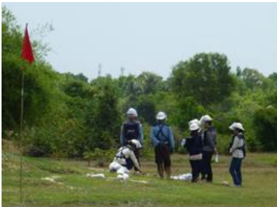
大使館視察（回収現場視察）