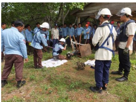
ロケットレンチを使用した実爆実習