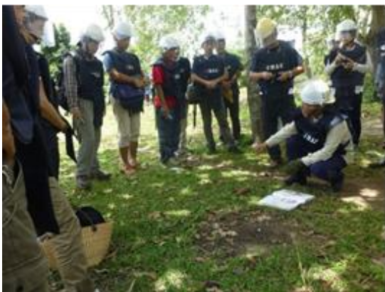
研修者に対し不発弾の説明