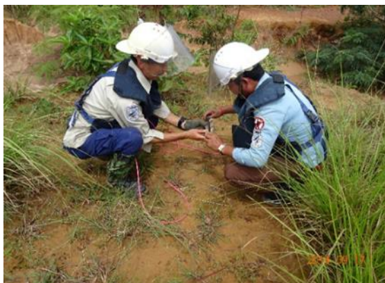
導爆線と爆破薬の縛着要領