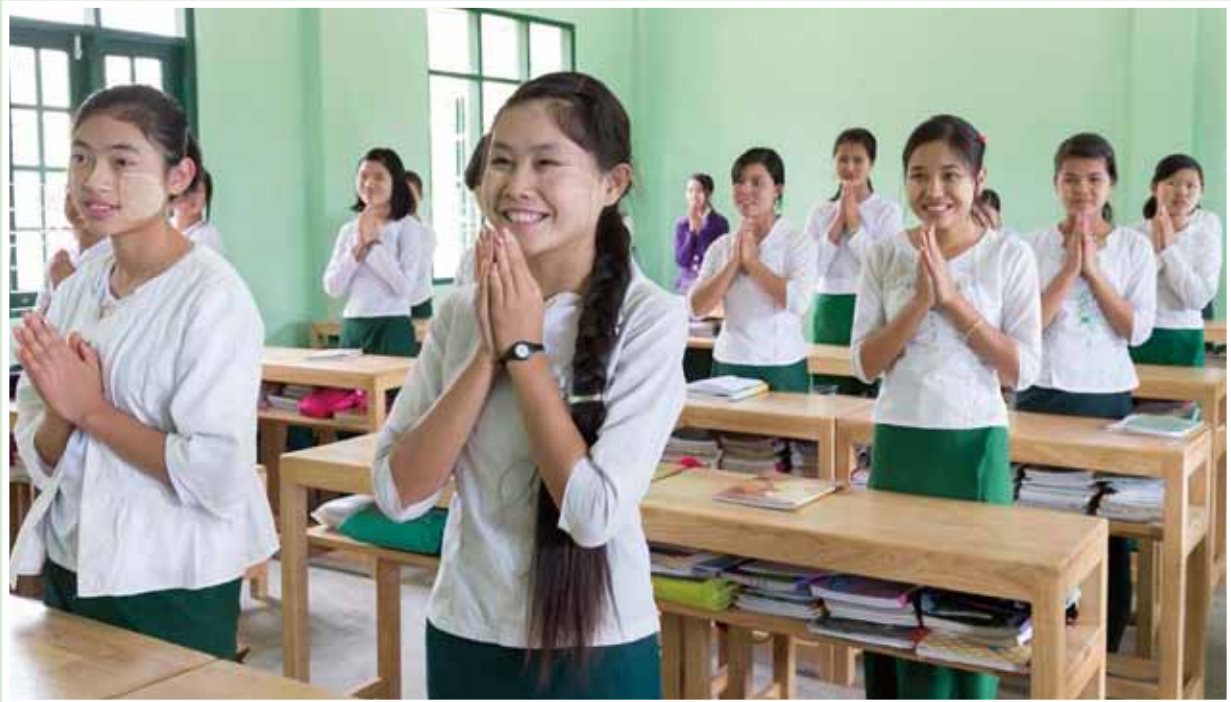
“Proyecto de construcción de la escuela primaria y secundaria Kunlong en el distrito Kunlong, del estado Shan”, República de la Unión de Myanmar, año fiscal 2013