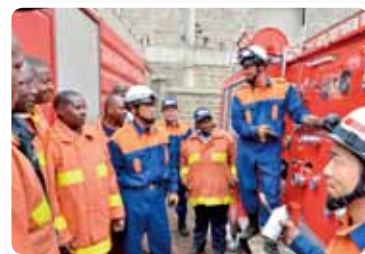
“Proyecto de reutilización de camión de bomberos en el condado de Nairobi”, República de Kenia, año fiscal 2015