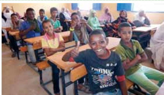
“Proyecto de mantenimiento de la primera escuela primaria de la ciudad Chegar”, República Islámica de Mauritania, año fiscal 2015

En Japón, la Asistencia Financiera No Reembolsable para Proyectos Comunitarios de Seguridad Humana, se conoce generalmente como “Kusanone”. “Kusa” significa hierba, mientras que “Ne” conlleva el sentido de las raíces.