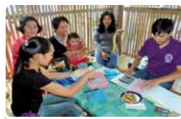
“Proyecto de apoyo para fondos de Micro Créditos en Cotabato del Sur, Mindanao”, República de las Filipinas, año fiscal 2010