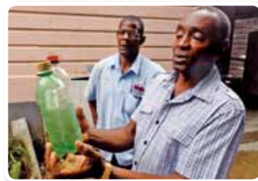
“Proyecto de formación de seguridad y protección ambiental de los alimentos para los productores de café”, Jamaica, año fiscal 2010