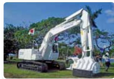
“Proyecto para la donación de un equipo contra minas antipersonal en el departamento del Meta Tolima”, República de Colombia, año fiscal 2009