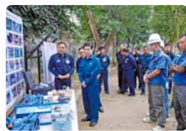
“Proyecto de reducción de agua no facturada en el municipio Mayangon de la región Yangon”, República de la Unión de Myanmar, año fiscal 2013