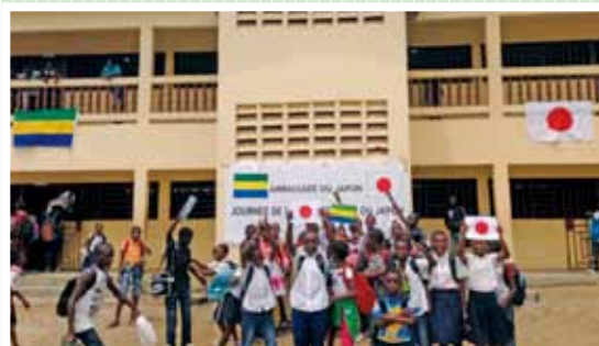
“Proyecto de mantenimiento y ampliación de la escuela primaria Charbonnages”, República de Gabón, año fiscal 2013