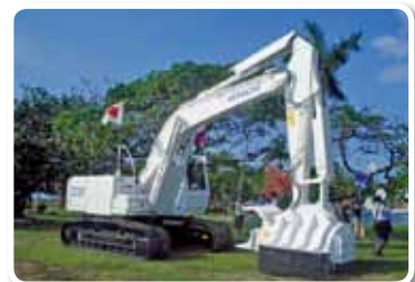
コロンビア共和国 2009年度「メタ県・トリマ県 対人地雷除去機材整備支援計画」