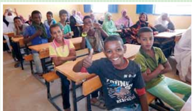
モーリタニア・イスラム共和国 2015年度「シェガル市第一小学校整備計画」

これからも「KU・SA・NO・NE」の種を広げ、世界中に幸せの花を咲かせていきます。