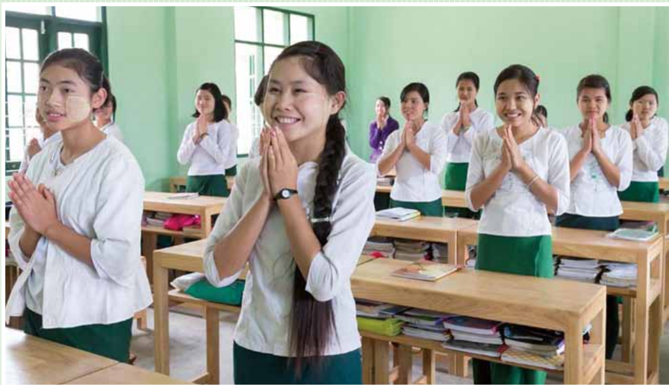
ミャンマー連邦共和国 2013年度「シャン州クンロン地区クンロン小中高等学校建設計画」