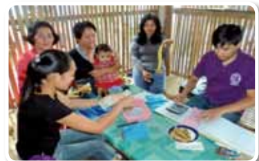
フィリピン共和国 2010年度「ミンダナオ島南コタバト州におけるマイクロ・クレジット原資支援計画」