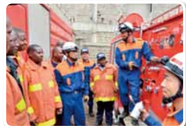
ケニア共和国 2015年度「ナイロビ郡における中古消防車再利用計画」