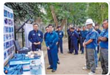
ミャンマー連邦共和国 2013年度「ヤンゴン地域 マヤンゴン地区無取水低減計画」