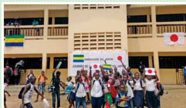
ガボン共和国 2013年度「シャルボナーージュ小学校増築整備計画」