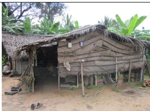
北部ムラティブ県 Visuvamadu west 地区 帰還民の家屋の例