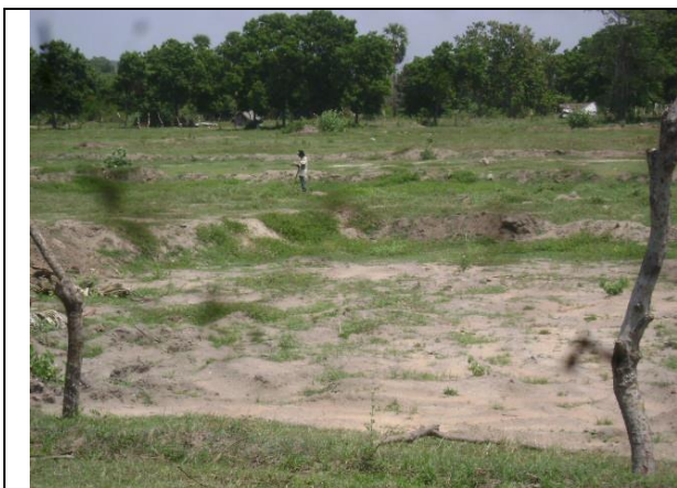
東部アンパラ県ティルックコービル郡 Kanchchikudichchiaru 地区。 農業用井戸建設を予定している。