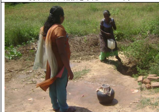
東部アンパラ県ティルックコービル郡 Thangavellyuthapuram 地区。住民たちは写真のよ うな穴から水を汲んでいる。