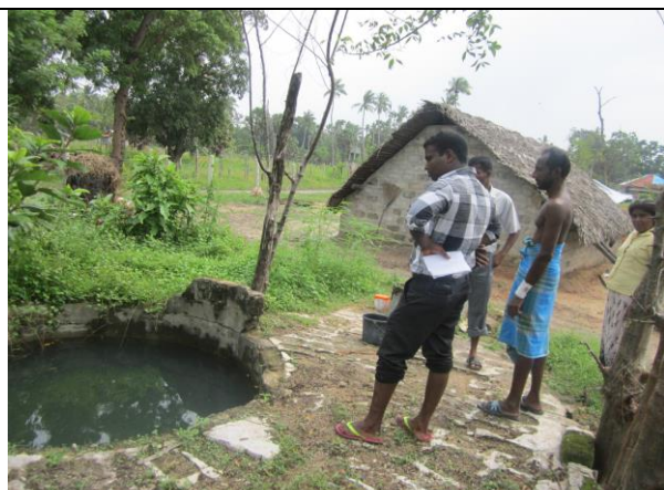
北部ムラティブ県 Visuvamadu east 地区 紛争で破壊されたままの家庭用井戸