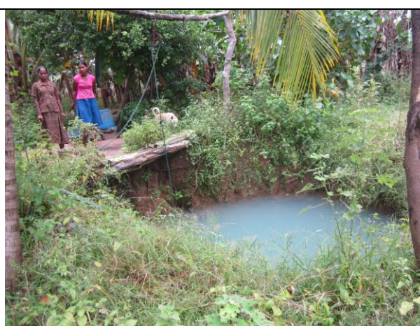
北部ムラティブ県 Visuvamadu east 地区 管理されず不衛生な井戸の様子