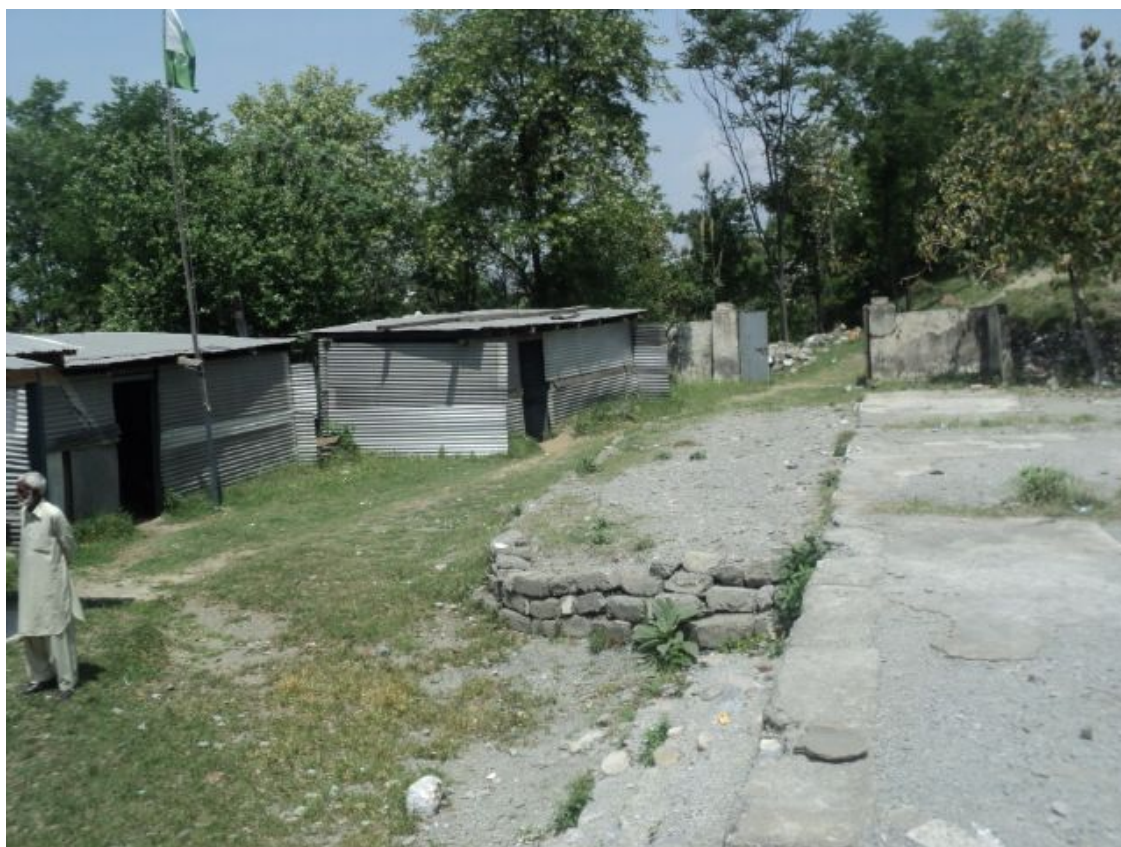
ジャンگران女子中学校：事業開始前の様子