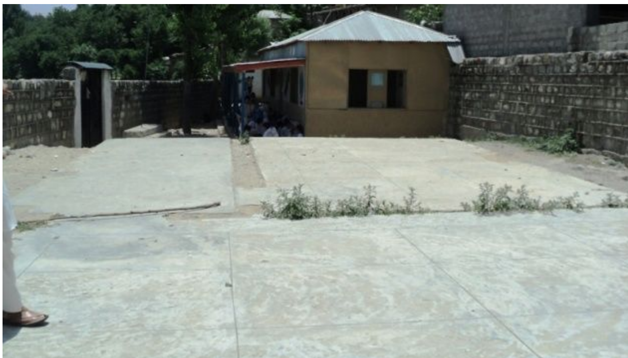
カチカキ女子小学校：事業開始前様子 コミュニティによって建てられた仮校舎があるが、生徒全員は入れない