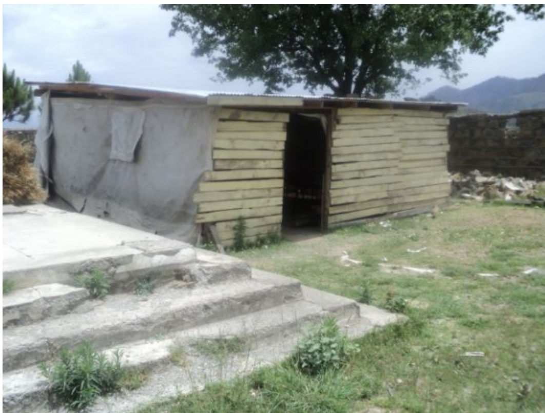
ダングラ女子小学校：教室として使用しているバラック