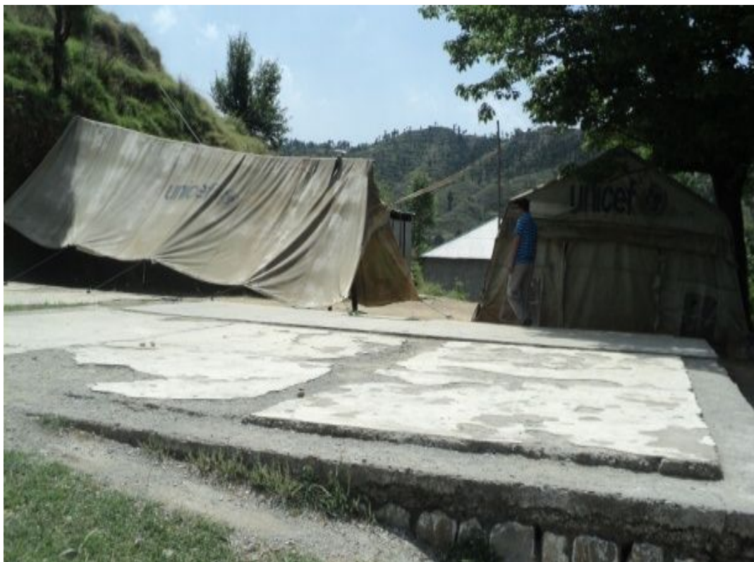
ナビール男子小学校：半壊のテントのテントがあるばかり