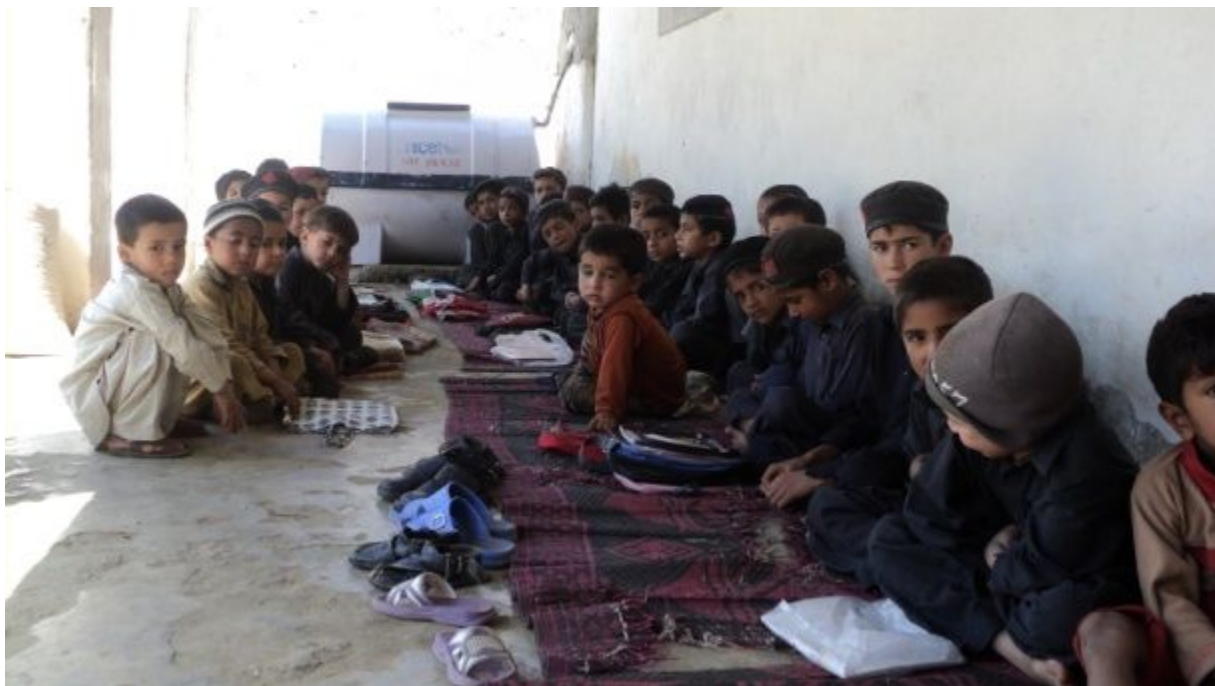
ニカパニ男子小学校：危ないので建物の中には入らず、外で勉強している生徒たち