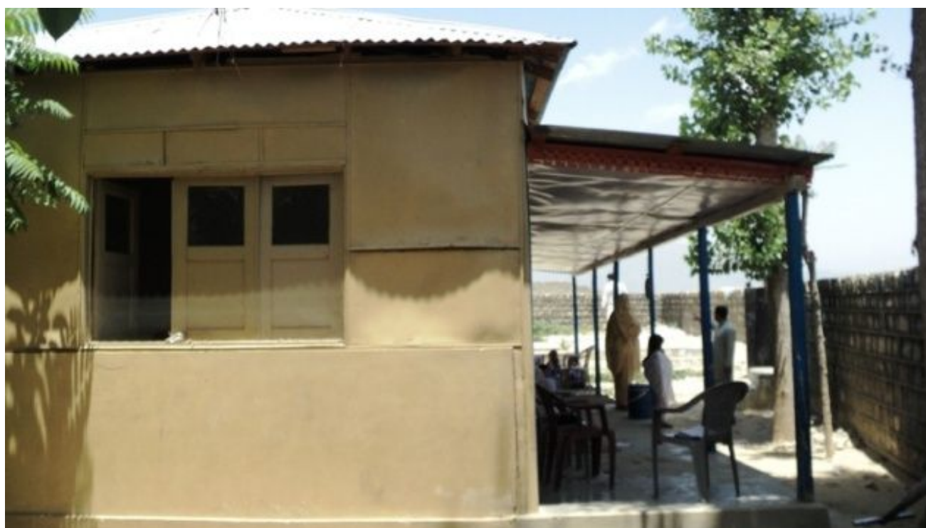
カチカキ女子小学校： コミュニティによる簡素な仮校舎