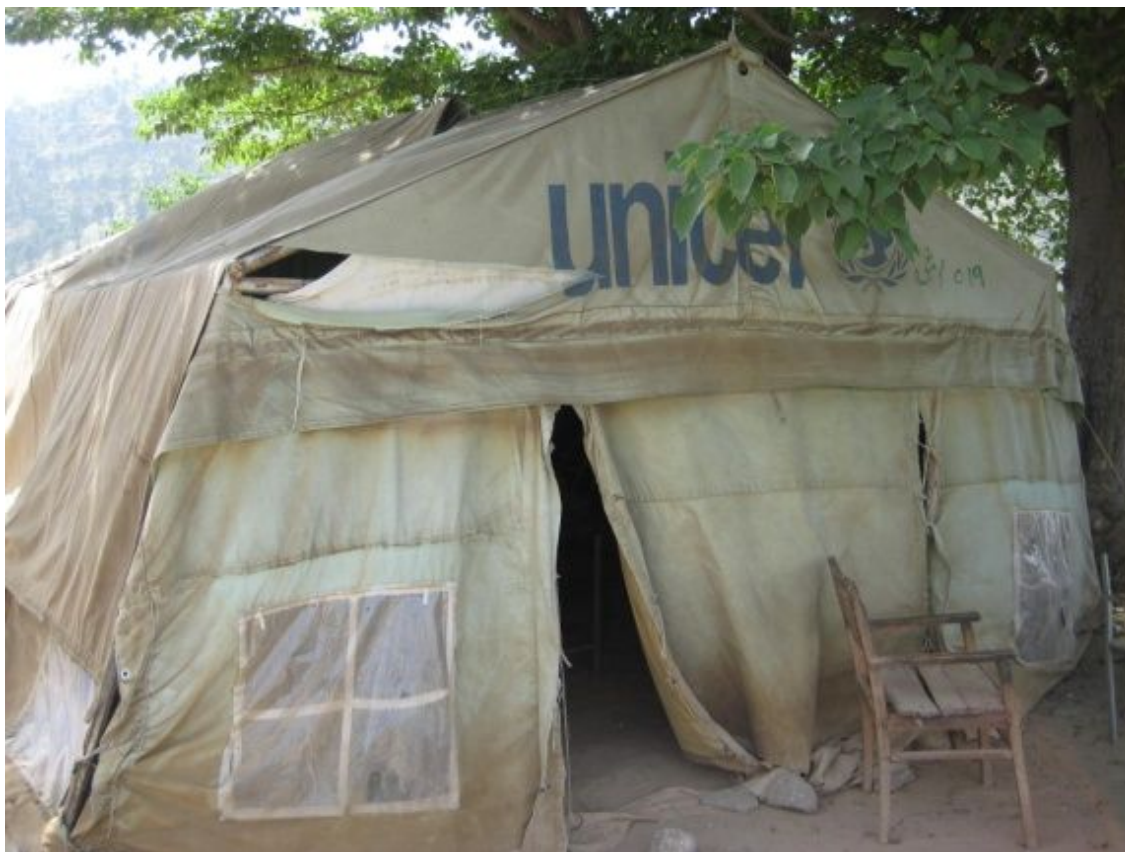
ナビール男子小学校：事業開始前の様子 子どもたちはこのテントで勉強している。