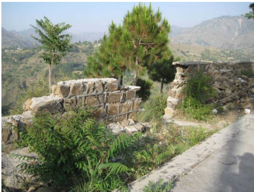
ダングラ女子小学校：壊れた境界壁で、危ない