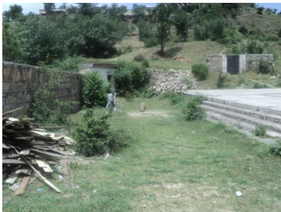
ダングラ女子小学校：事業開始前の様子