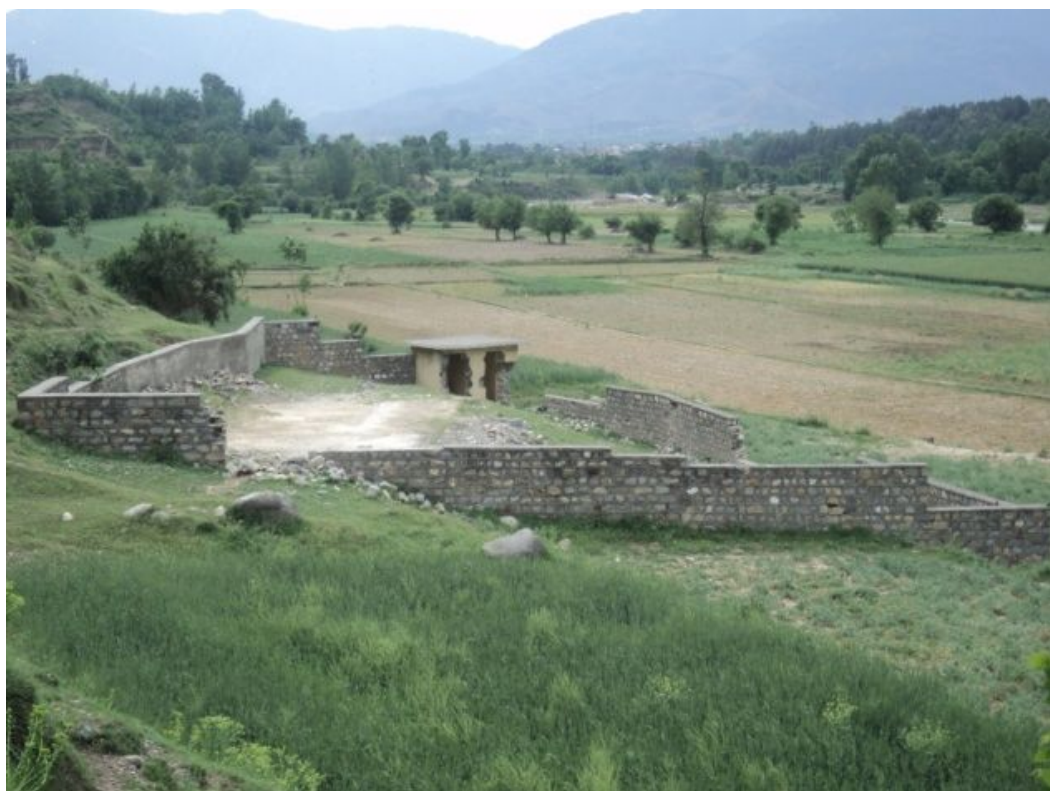
ミリヤバンダ女子小学校： 事業開始前様子