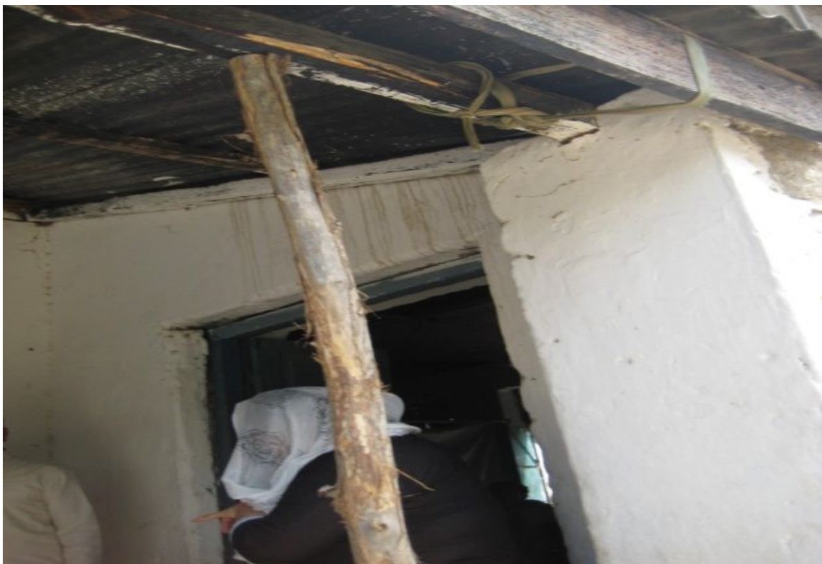
ニカパニ男子小学校の仮校舎：つかえ棒のような柱で危なくて校舎に入れない