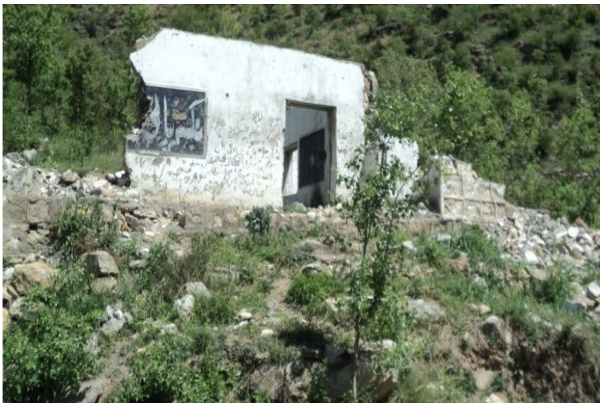
ニカパニ男子小学校：地震で倒壊したままの校舎