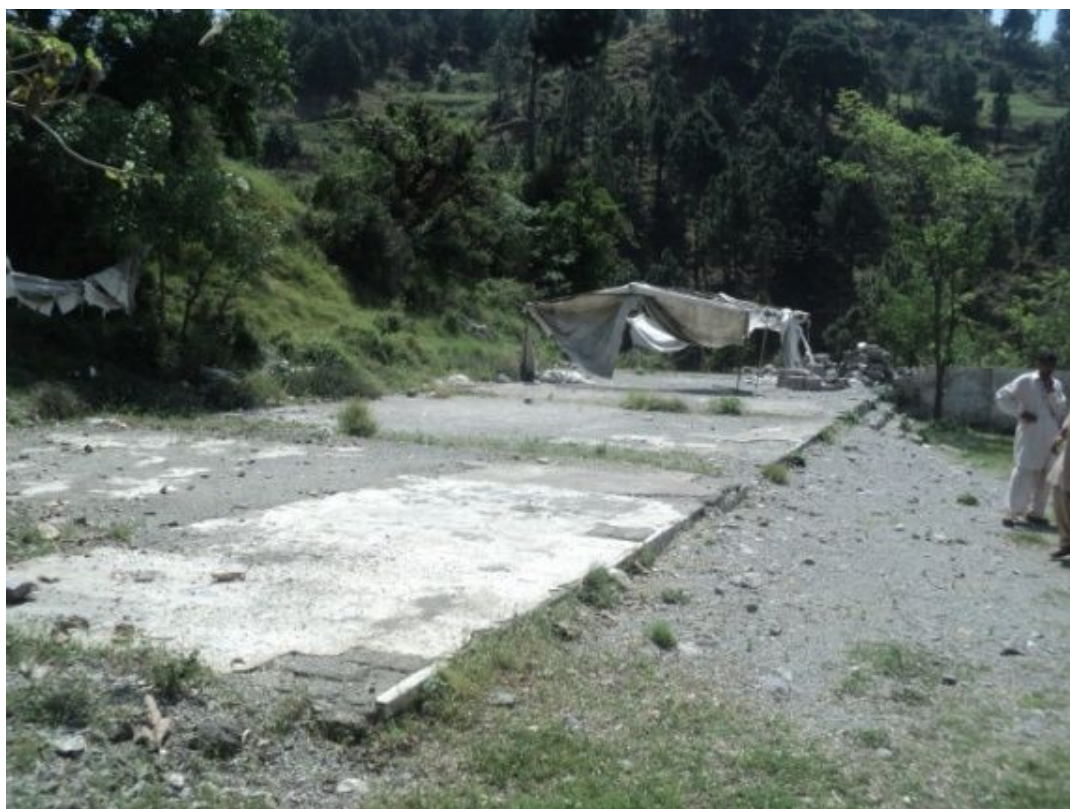
ジャングラン女子中学校：事業開始前の様子