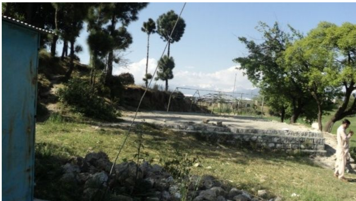
ブッサ男子小学校：事業開始前様子