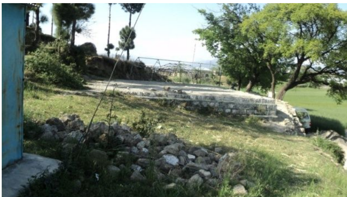
ブッサ男子小学校：事業開始前様子