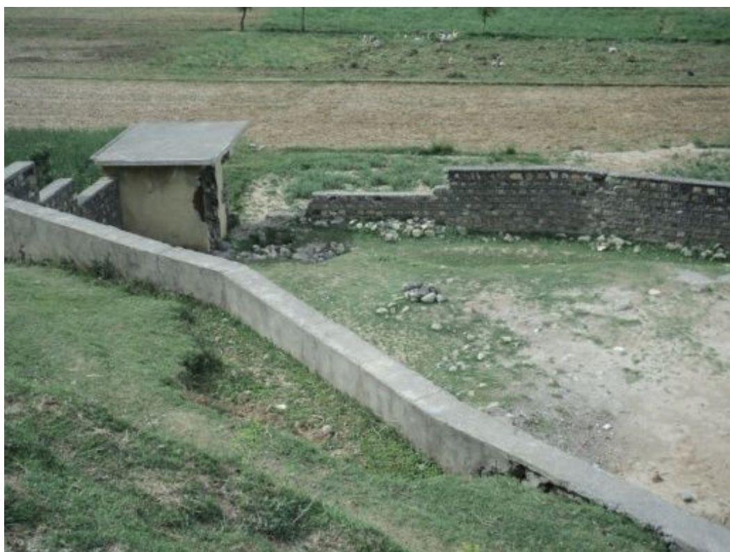
ミリヤバンダ女子小学校： 事業開始前様子 校舎が地震で倒壊した後は、テントすらなく、子どもたちは近所の篤志家の家で勉強をしている