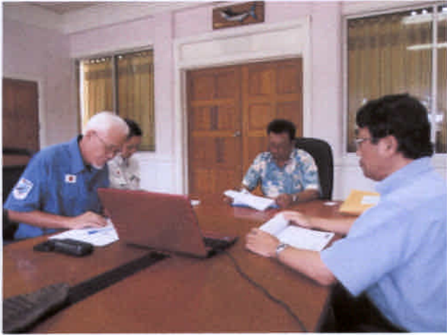
大統領に調査結果の報告