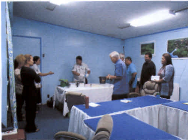
ワーキンググループに対する処理要領展示