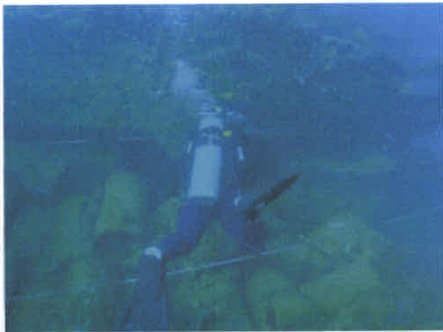
爆雷の位置を記録する専門家