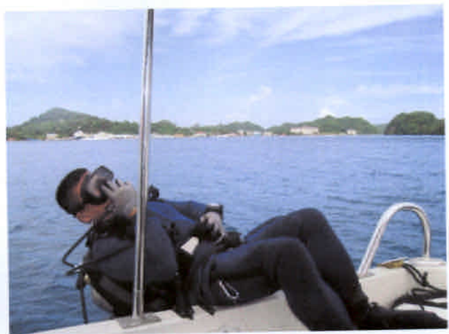
海中調査を開始する牧専門家