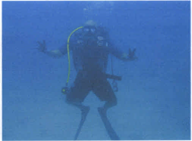
安全確認訓練をするイガン隊員