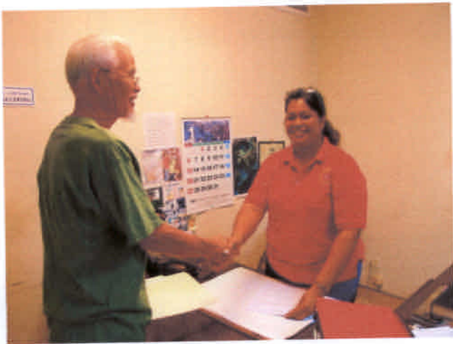
コロール州との海中調査合意