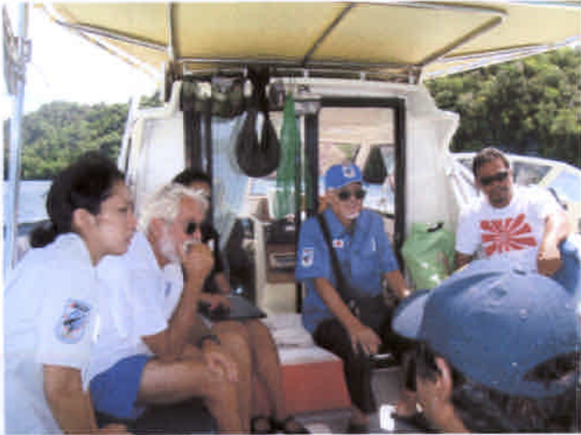
ワーキンググループに対する現場説明