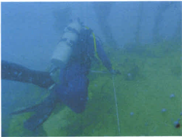
グリットを引く専門家