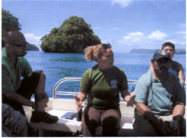
アキオ局長現場視察