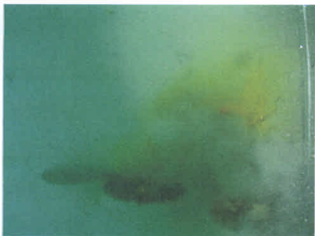
爆雷の亀裂から漏洩するピクリン酸（黄色）