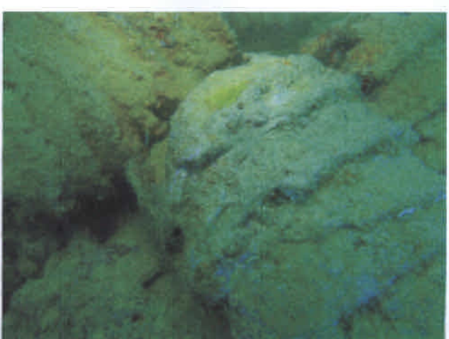
ヘルメットの残骸