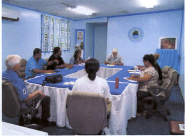
ワーキンググループに対する処理要領説明