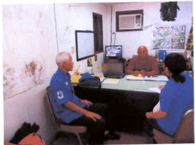
レンジャーへの支援依頼