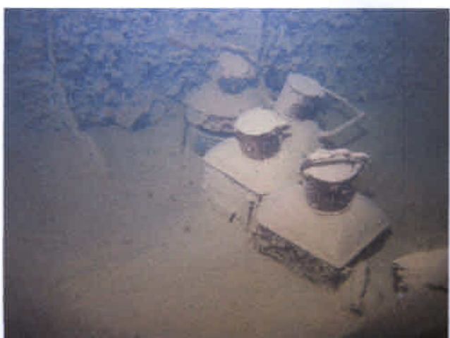
船室にあるランプ