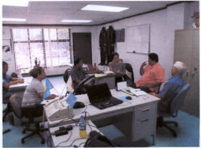
官房副長官等に対する処理計画の説明