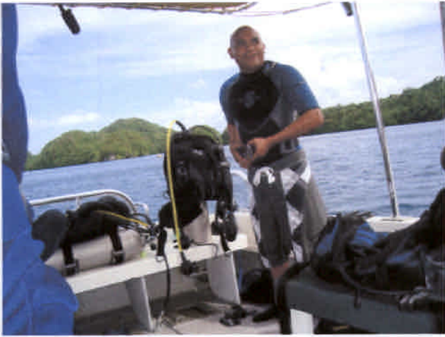
共同作業するレインジャーのイガン隊員