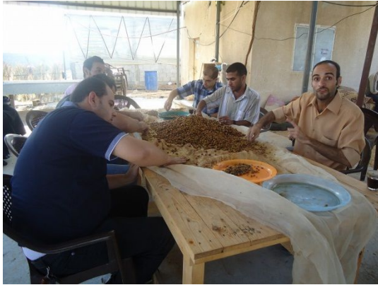
写真 1: 育苗用種子(オリーブ)の準備 (研修農場作業場)