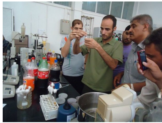
写真 10: 食品分析実験の様子