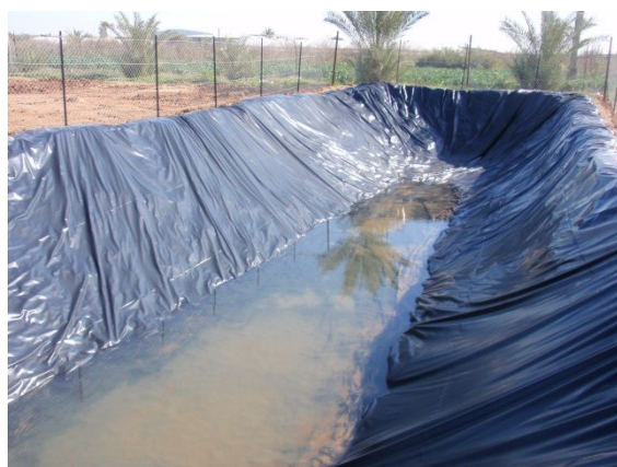
写真 15: 雨水集水用ため池 (研修農場)