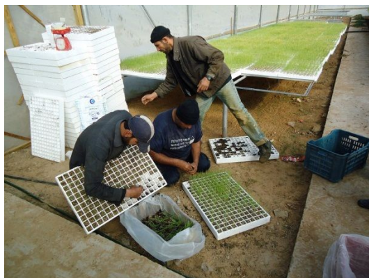
写真 13: 苗木(玉ねぎ)配布作業 (育苗用グリーンハウス)