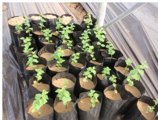
写真 12: 配布用苗木(アズ) (育苗用グリーンハウス)