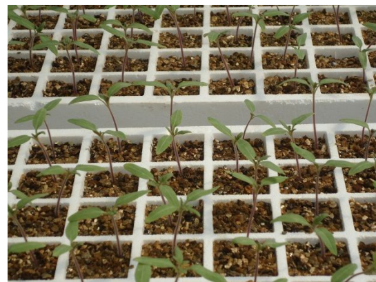
写真 6: 実習用苗(トマト) (研修農場グリーンハウス)