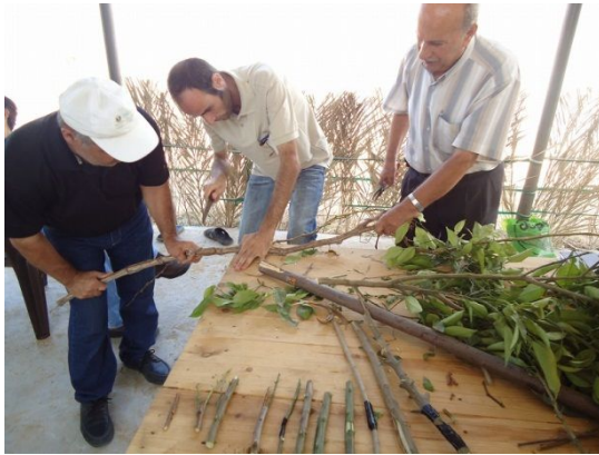
写真 9: 果樹接木実習の様子