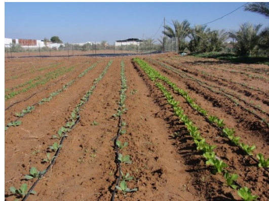
写真 8: 露地栽培実習(レタス・カリフラワー) (研修農場)