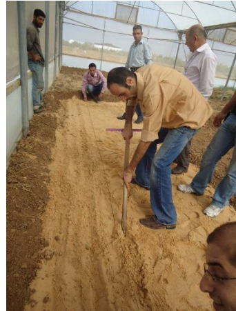
写真 2: 苗床(果樹)の準備 (研修農場グリーンハウス)