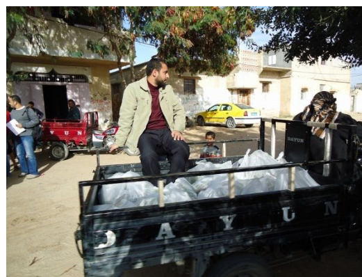
写真 14: 農家への苗木配布(玉ねぎ) (ガザ南部ラファ)