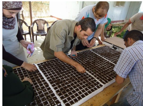
写真 4: 播種作業 (研修農場作業場)