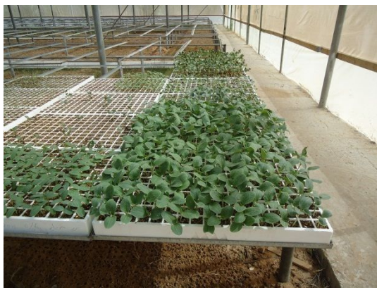
写真 5: 実習用苗(キュウリ) (研修農場グリーンハウス)