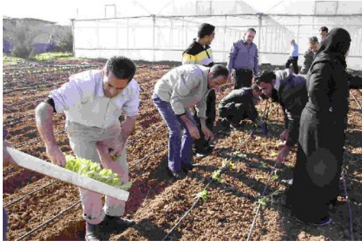
写真 7: 露地栽培実習の様子 (研修農場)