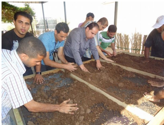
写真 3: 育苗用培養土の作成 (研修農場作業場)