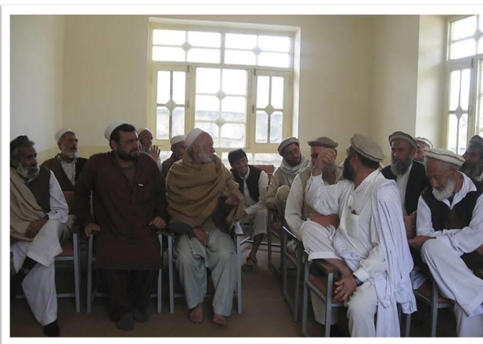
【ゴレーク保健委員会の会合の様子 （2013.3.3）】