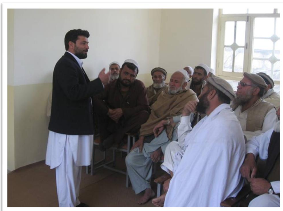
【ゴレーク保健委員会で話をするコミュニティ担当スタッフ（医師、左）】