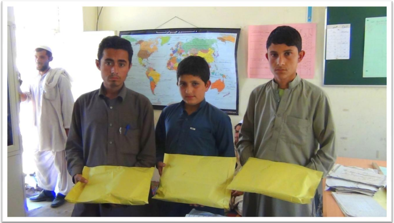
【壁新聞活動に参加し、優秀作文を書いた生徒たち】