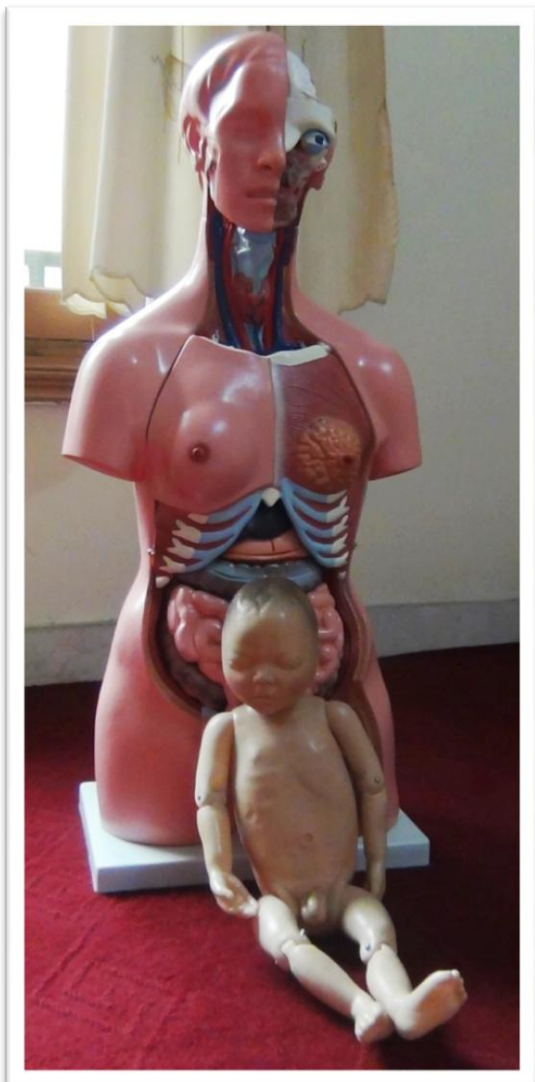
【女子学校での応急手当実習に使用した人体模型】