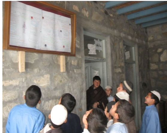
壁新聞に見入る生徒たち