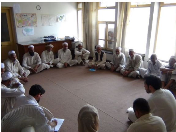
村の保健委員会と話し合う JVC スタッフ