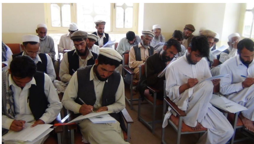
健康教育について学ぶ学校の保健担当教員