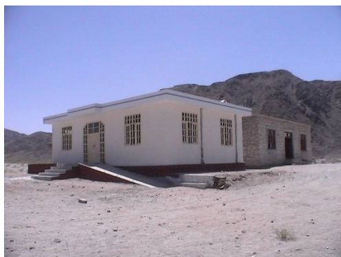
2007年頃(建設途中)のようす