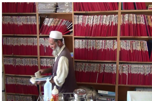
来診した患者のカルテ“ファミリーヘルスブック”を選別し医師に運ぶガードマン