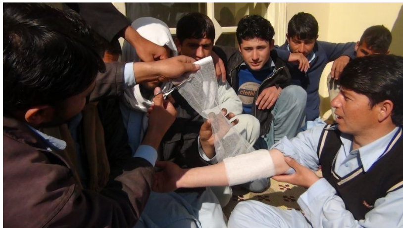
中学・高校生を対象にした応急手当トレーニングのようす