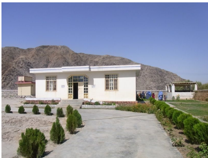
建物と塀の建設が完了した診療所(2012年1月現在)