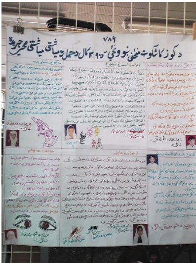
学校の生徒が毎月投稿し作成される健康に関する壁新聞