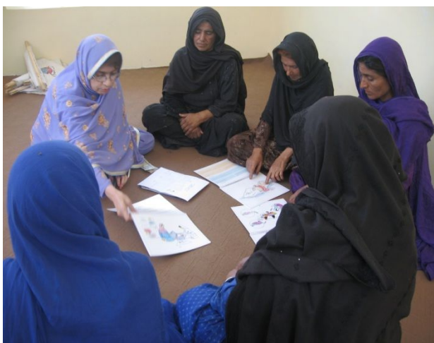
母親教室を新規に始めるためのトレーニングを受ける伝統産婆