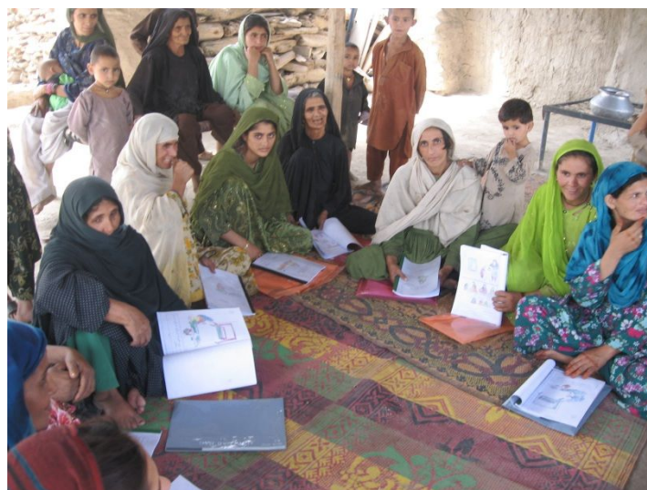
女性地域保健員の家で母親教室をうける村の女性たち