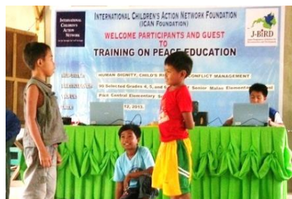
演劇で平和構築を学ぶ