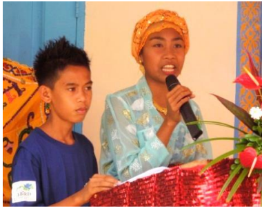
宣言文の読み上げ