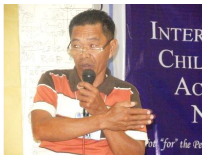
地域リーダーの役割は