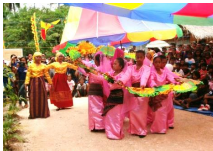
生徒による出し物①