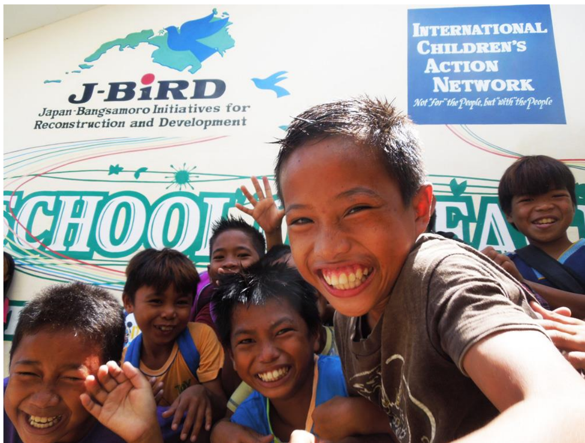
「平和の学校」で学ぶことを喜ぶ生徒たち（ヌグアン村中学校）