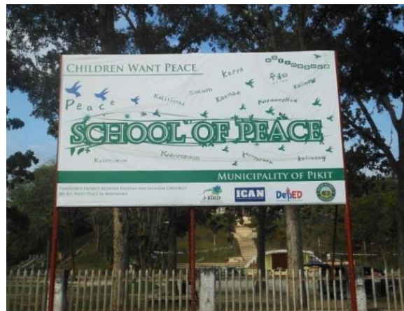
ピキット町広場前の掲示板