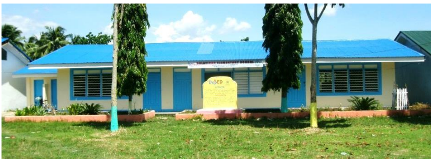
1 棟目：3 教室（天井、屋根、窓などの修復）