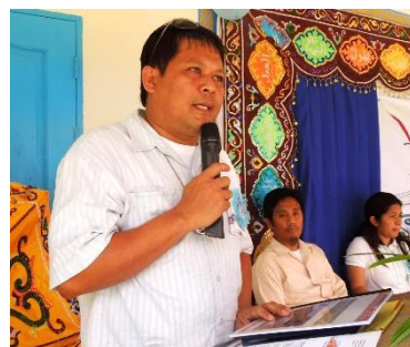
教育省第 12 地区事務所代表