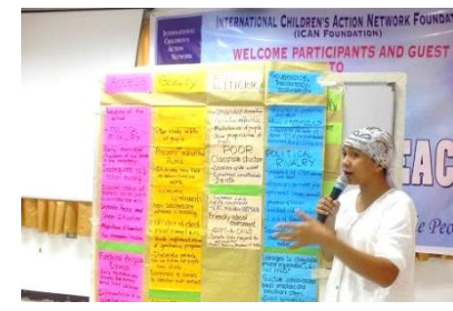
学校年間計画をまとめ