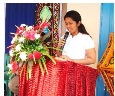
ピキット町長のスピーチ