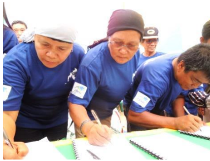
宣言文に署名する村長（右2名）