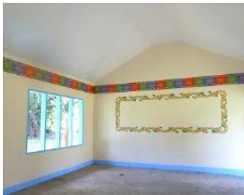
室内の伝統デザイン