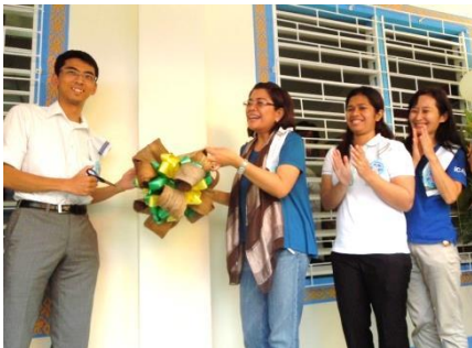
教室受渡式のテープカット