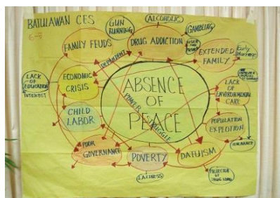
平和を阻害しているものは何か？