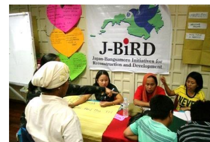
平和に対する教師の役割とは