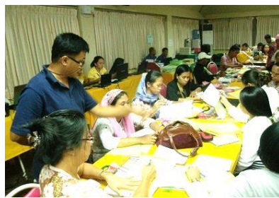
平和教育授業案を練る