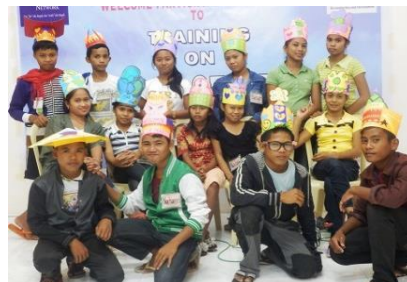
学校平和活動のリーダーたち