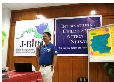
平和教育専門スタッフの講義