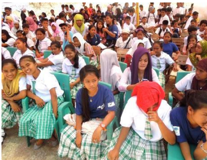
式典に集まった生徒たち