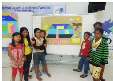
私たちの平和の学校