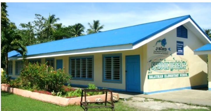
2 棟目：3 教室（天井、屋根、窓などの修復）