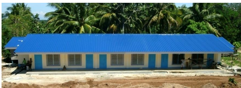
新築の1棟3教室（両翼に男子用と女子用トイレ）