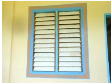
窓枠の伝統デザインの縁取り