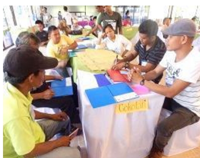
村ごとに問題を討議