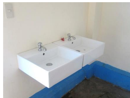
トイレ内の手洗い場