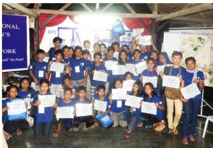
参加者の子どもたち