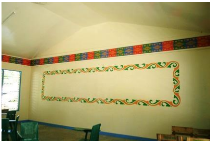
教室内の伝統的なデザイン