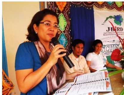
コタバト州知事のスピーチ