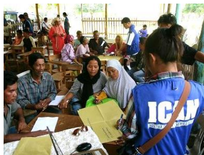
地域で問題を話し合う