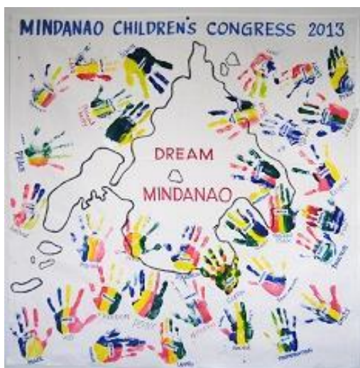
将来に向けた夢と誓い