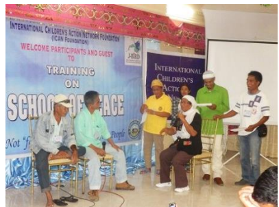
平和への女性の意見を聞く