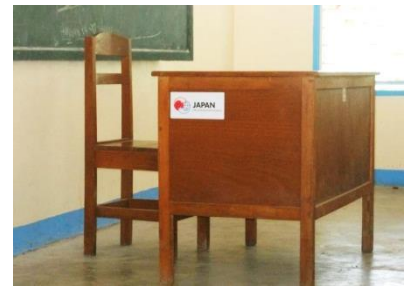
先生用の机と椅子