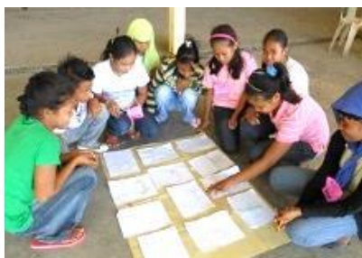
平和の絵を比べて話し合う