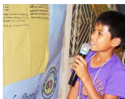
グループ討議の結果を発表