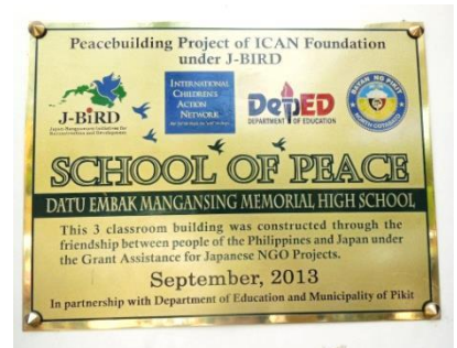
平和の学校プレート