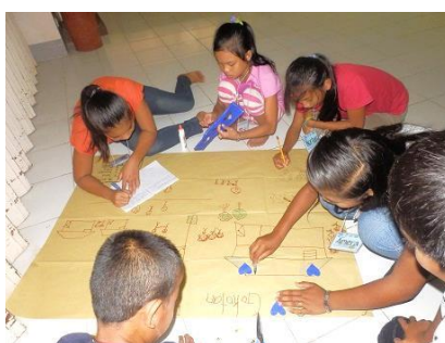
子どもたちの考える平和