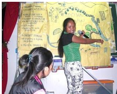
地域の現状を共有する