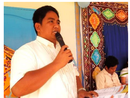
教育省コタバト事務所代表