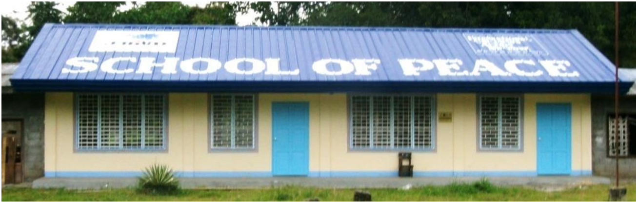
1棟2教室の修復（床面を上げて浸水を予防し、部屋の空間を広げるため屋根も高く修復した。）