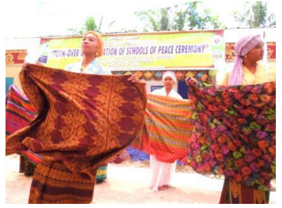
生徒による出し物②