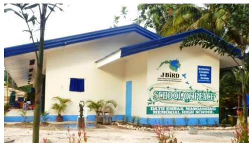
校舎横壁の「School of Peace」ロゴ