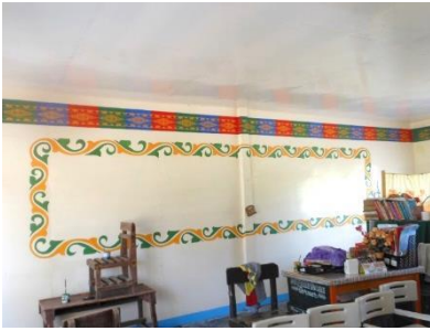
教室の壁の伝統的飾りデザイン