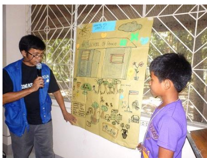
質問を投げかけるスタッフ