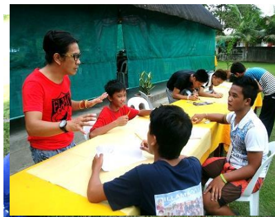
解決策を話し合う