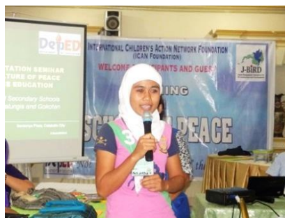
研修での学びを共有する先生