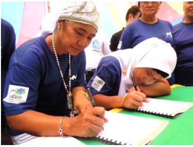
宣言文に署名する先生と子ども