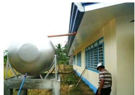
雨水を貯めるタンク