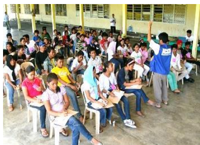
子どもの権利・責任とは？