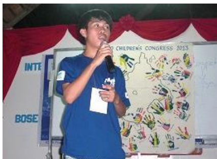
平和の課題を話し合う