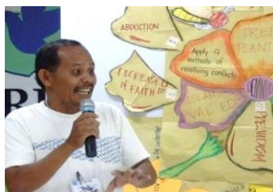
先生の発表に力がこもる