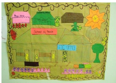
子どもたちが描いた平和の学校