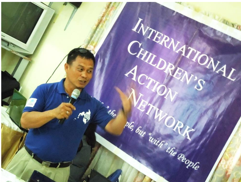
ICAN スタッフの平和教育専門家による研修