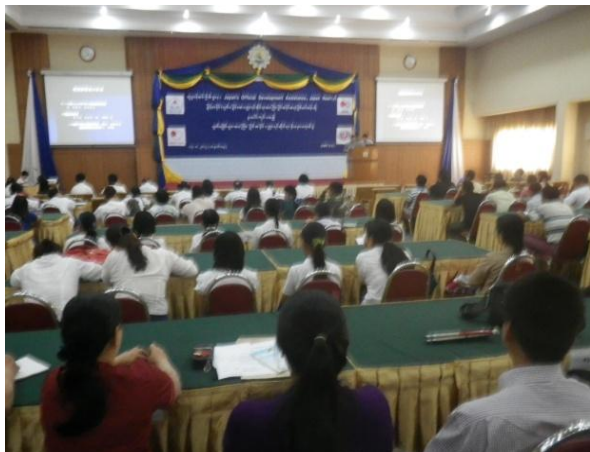
緒方短期専門家による講演