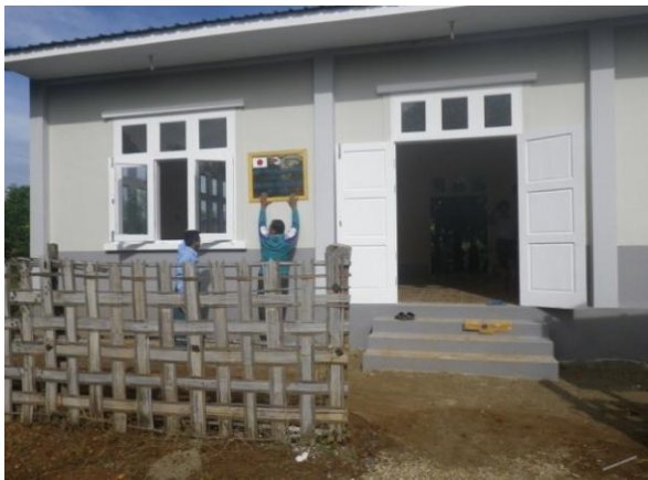
完成目前のマッサージ施設