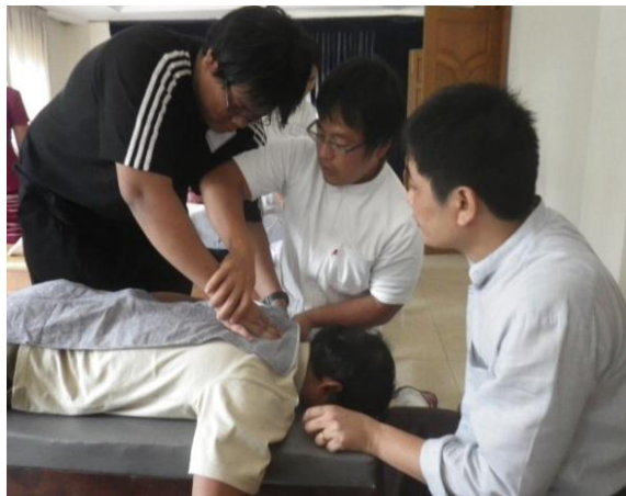
相川短期専門家による講演