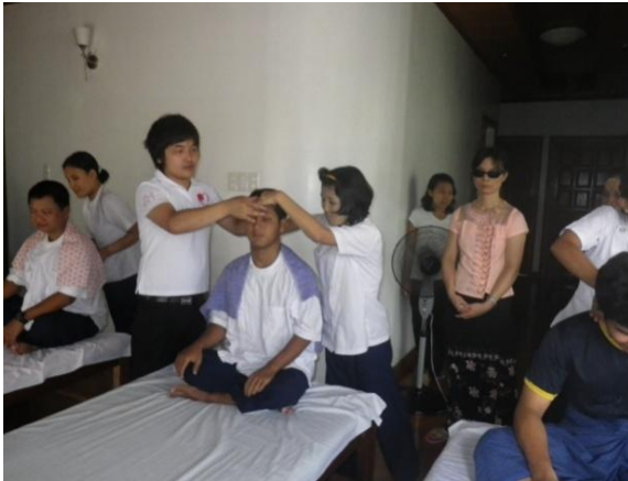
杉浦短期専門家による実技指導