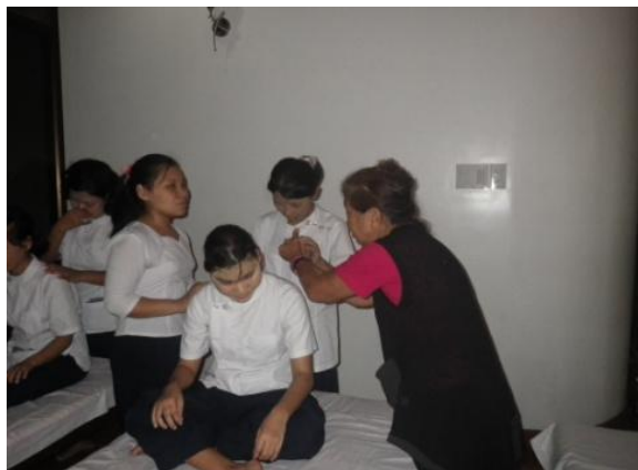
畑短期専門家による実技指導①