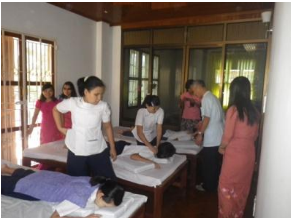
兼目短期専門家による実技指導