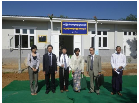
完成したマッサージ施設