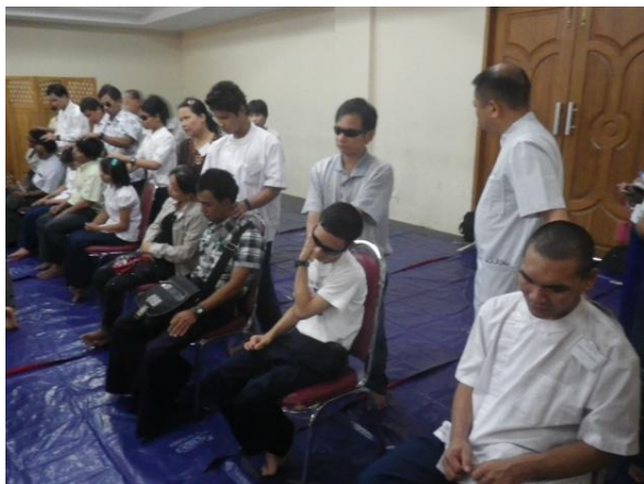
丸谷短期専門家による実技指導