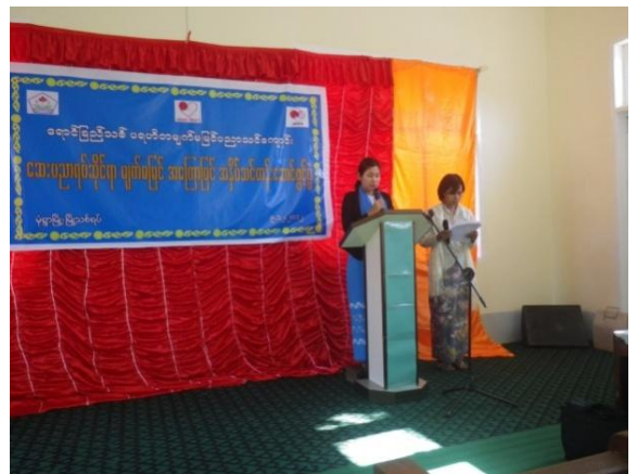
社会福祉省サガイン管区長挨拶