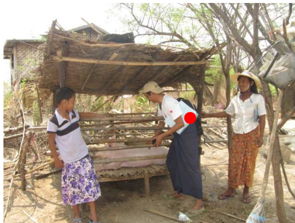
活動 3-5-2 畜産研修中級コース (飼育環境について助言する専門家 (●))