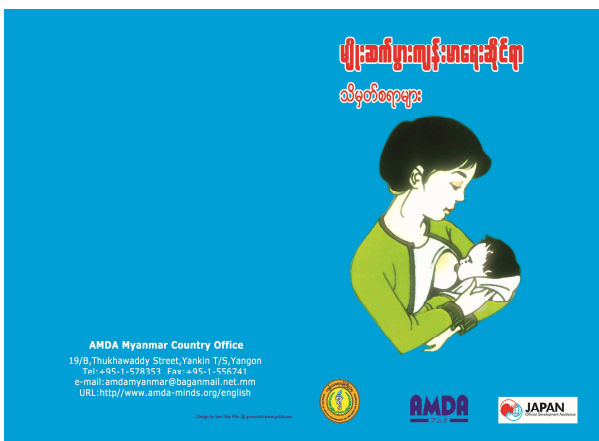
活動 1-1 健康教育教材の作成 (リプロダクティブ・ヘルスハンドブック)