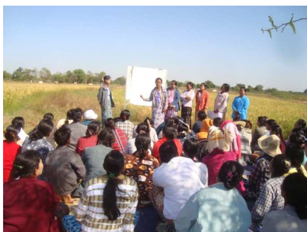
活動 2-7-2 成功事例のスタディーツアー （ダボック式稲作について説明する担当受益者）