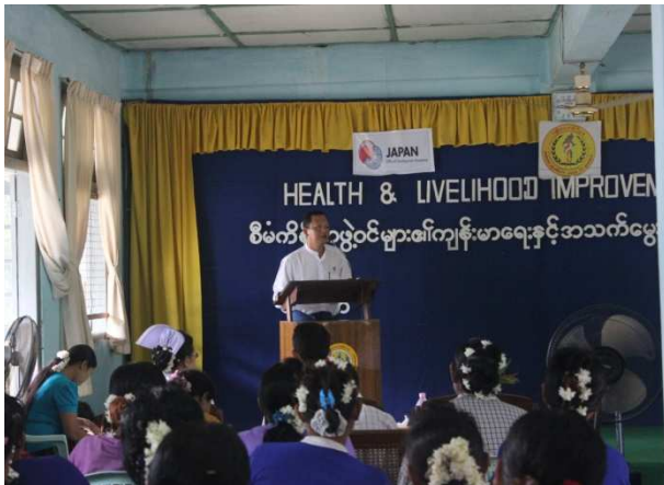
活動 4 事業成果発表会 (健康コンテストで開会の挨拶をする副郡保健局長)