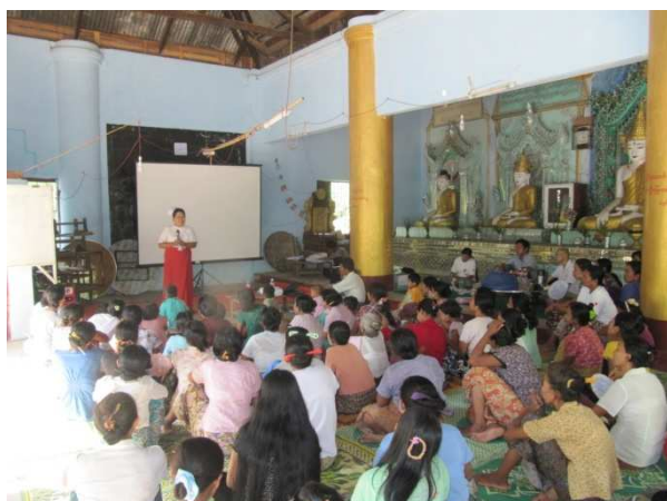
活動 1-6 リプロダクティブ・ヘルス啓発ミーティング (村の保健状況について説明する基礎保健スタッフ)