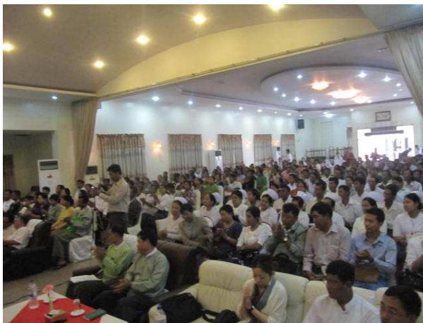
活動 4 事業成果発表会 (250名を超える参加者たち)