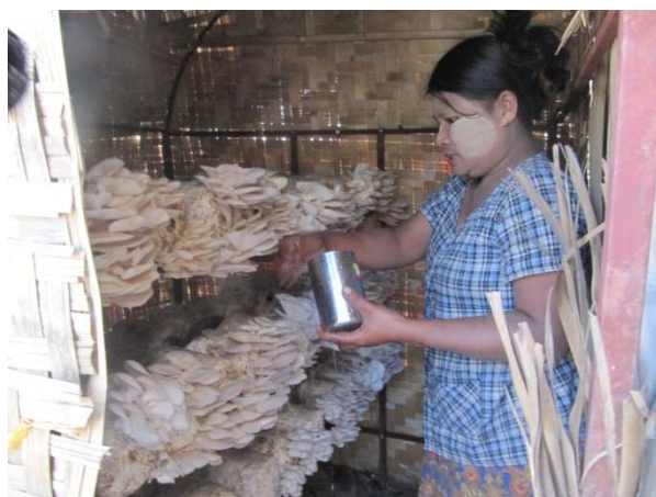
活動 2-5-3 農業研修非農家対象コース （研修後キノコ栽培を実践する受益者）