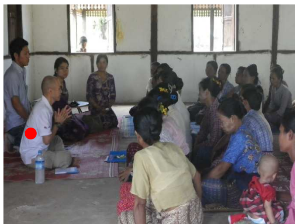
受益者から聞き取りを行う江橋事業統括 (●)