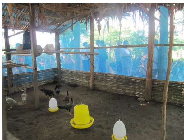
活動 3-8 スタディーツアー (モデル養鶏場を見学する受益者)