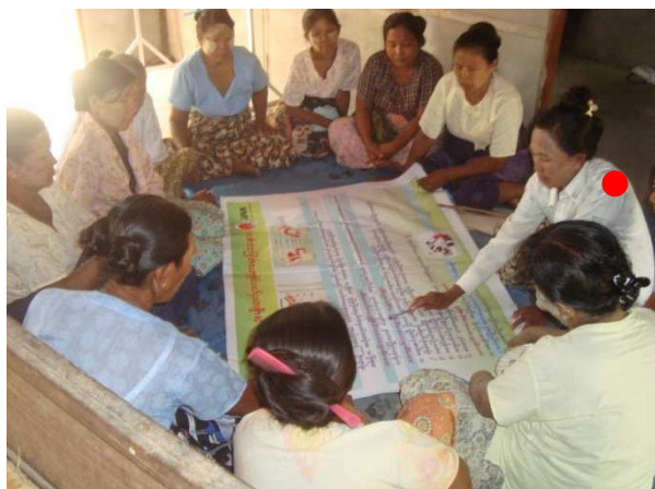
活動 1-5-3 ピアエデュケーター(●)による 健康教育