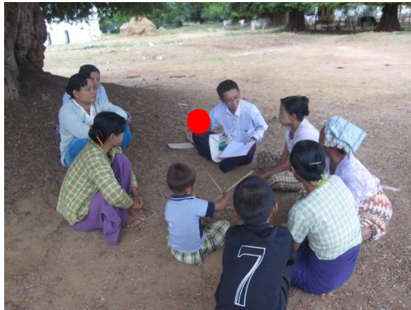
活動 3-2 研修内容の策定 (受益者から聞き取りを行う専門家 (●))