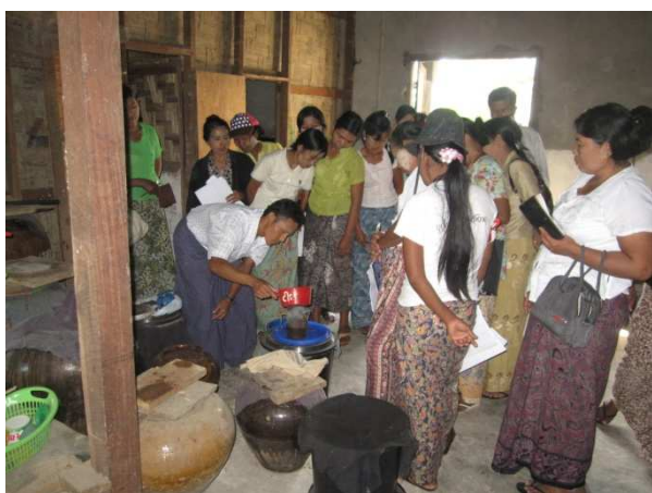
活動 2-7-1 OISCA スタディーツアー （有機殺虫剤の作り方を観察する受益者）