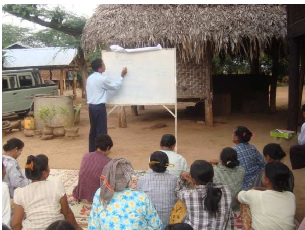
活動 3-5-1 畜産研修初級コース (郡畜産局職員による情報提供)