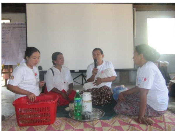
活動 1 - 6 リプロダクティブ・ヘルス啓発ミーティング (ロールプレイを披露するピアエデュケーター)