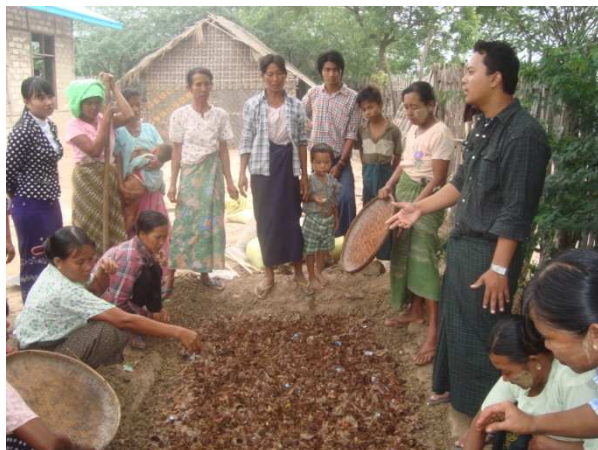
活動 2-5-1 農業研修初級コース （ボカシ肥料作成の実習をする受講者）