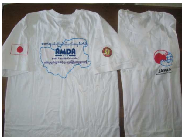
活動 1 - 2 健康教育啓発ツールの作成 (背中には「健康ピアエデュケーター」という文字)