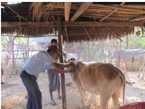
活動 3-7 予防接種プログラム (ワクチンを接種する郡畜産局獣医)