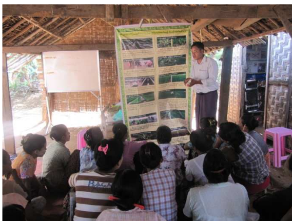
活動 2-5-2 農業研修中級コース （郡農業局職員による情報提供）