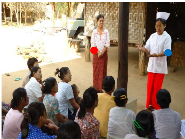
活動 1-7 本事業スタッフ（●）による健康教育 （基礎保健スタッフ（●）による質疑応答）