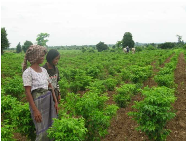
活動 2-5 農業研修 (ボカシ肥料を利用した受益者のチリ畑)