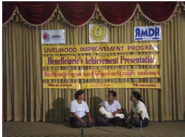
活動 4 事業成果発表会 (ロールプレイを披露する優秀賞村)