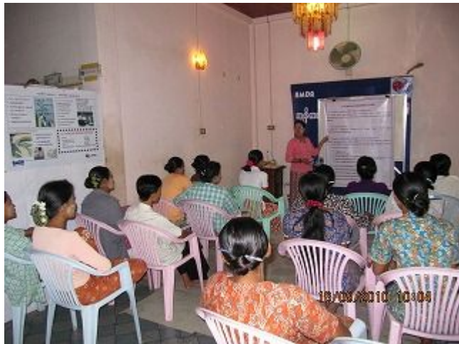
4. ピアエデュケーション研修の様子