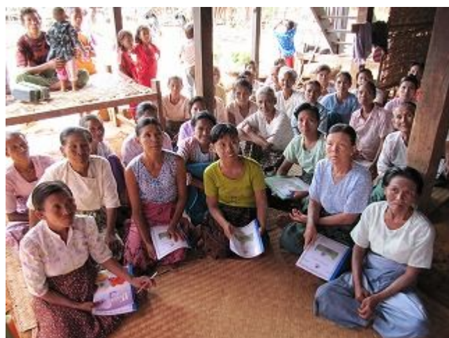
9. 農業研修テキストを受け取った受益者