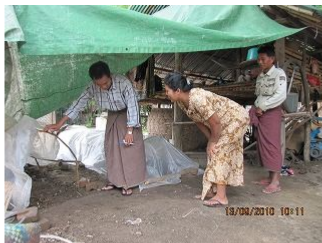
10. 農業研修中級コース（実践）の様子