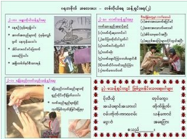
1. 作成した健康教育教材（個人衛生リーフレット）