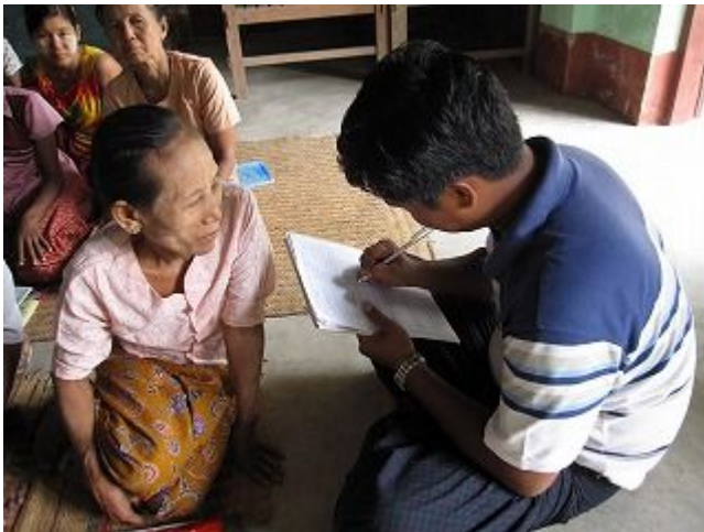
3. 生活習慣調査の様子