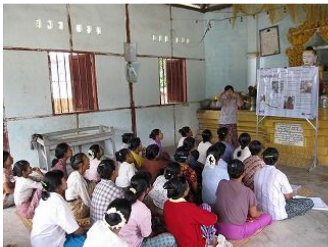
6. ピアエデュケーターによる健康教育