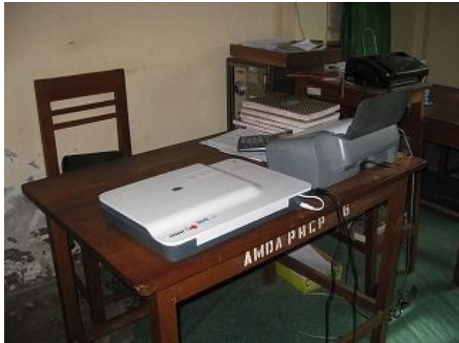
2. 本事業予算で調達したスキャナー