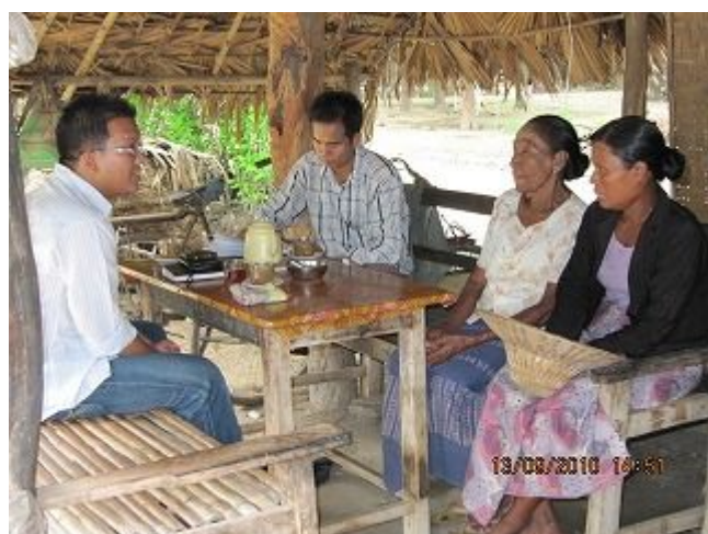
11. 現地スタッフによるモニタリングの様子