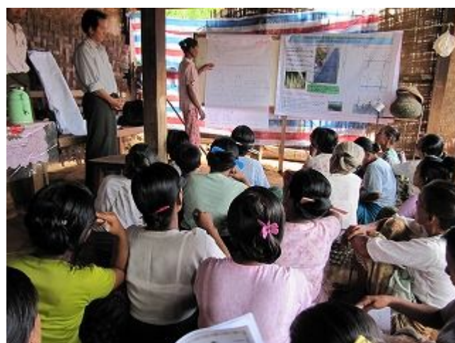
8. 農業研修中級コース（講義）の様子