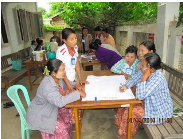
5. ピアエデュケーション研修の様子