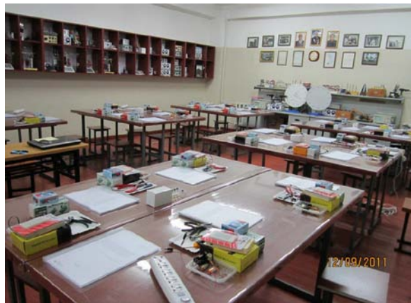
講座開始準備完了