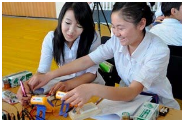
二極モータの作成実習