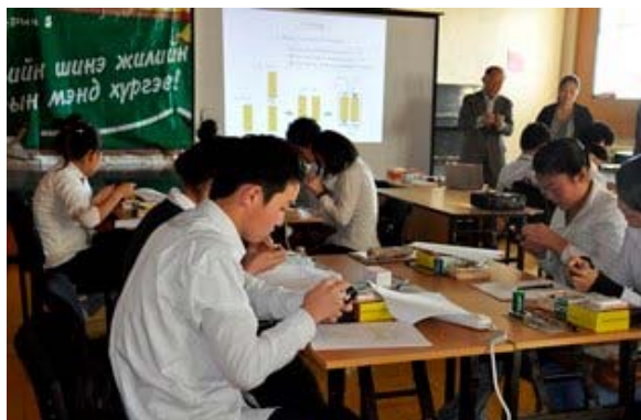
LEDの電流電圧特性測定の説明