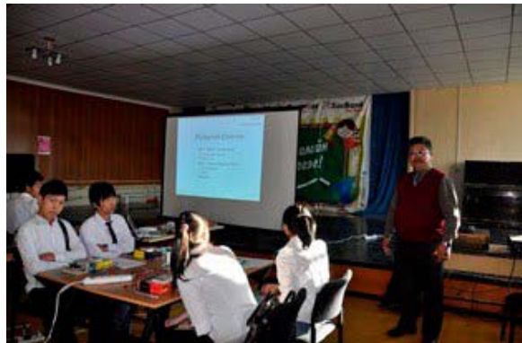
生徒向けモデル授業風景