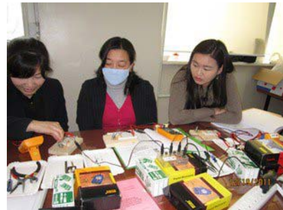
LEDを点灯し、電圧電流を測定している