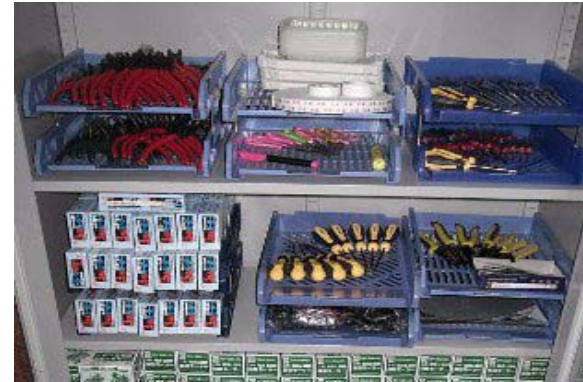
講座に使用する機材置き場