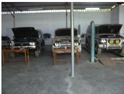
実習場に配置された教材車