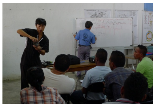
試験問題の解答を受ける研修生