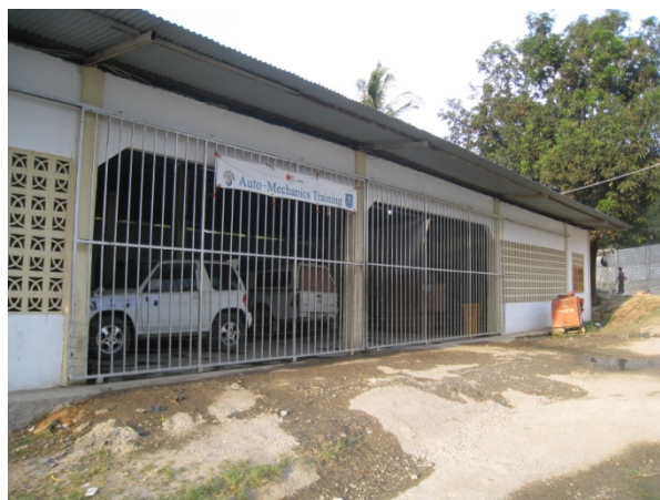
ディリ技術学校内にある実習場