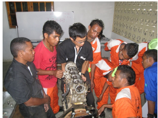
エンジン分解実習