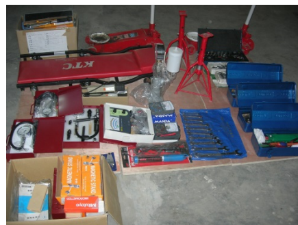
国内調達された工具（一部）