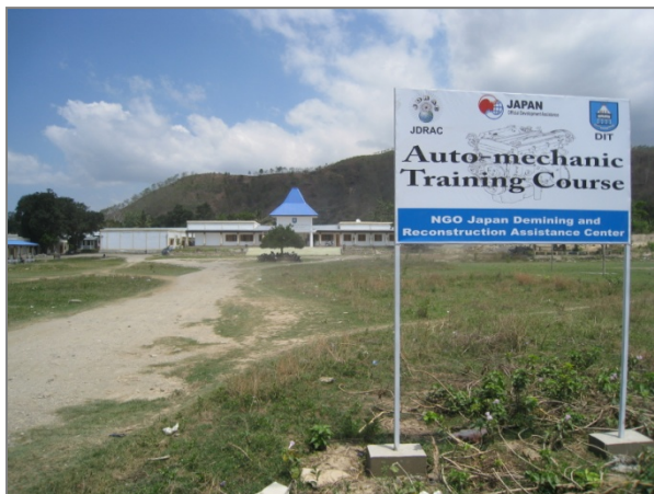
ディリ技術学校と第1期事業で制作した看板