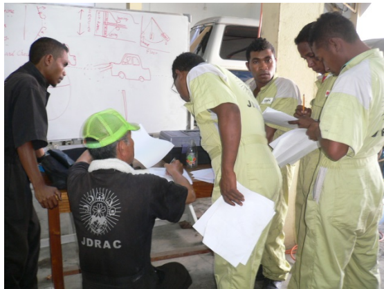
細かい注意を受ける研修生