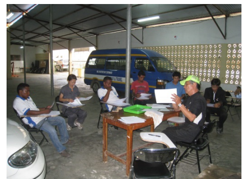
終了試験後の教官打合せ