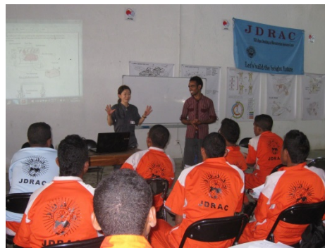
第2期久教官による講義