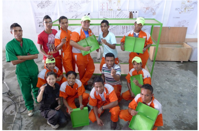
鉄製部品箱を自分達で作り満足そうな研修生達