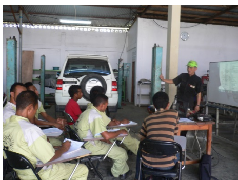
第2期高山教官による講義