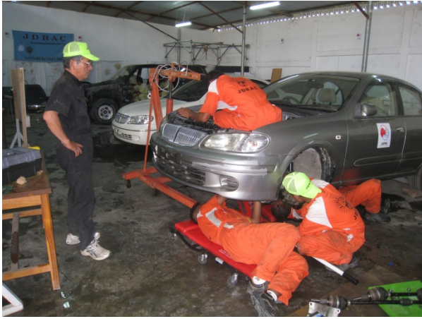
動力伝達装置の実習