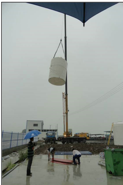
悪天候の中組立作業