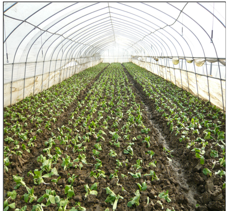
広大なビニールハウス農園 油化装置の原料となる