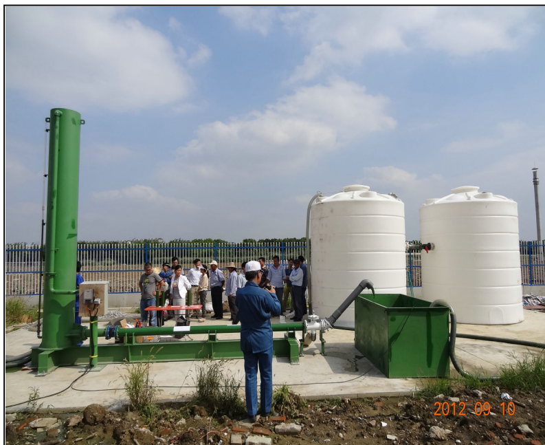
アオコ水撃処理装置実証実験開始