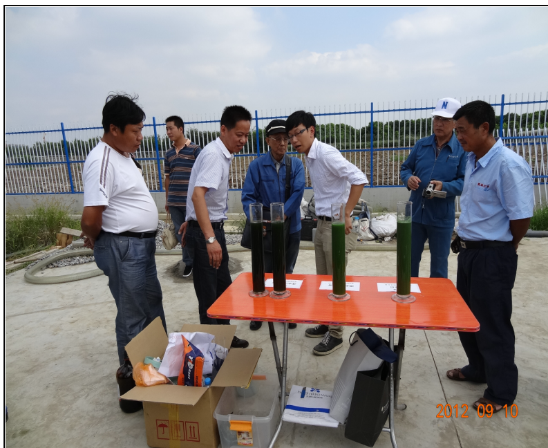
水利局幹部への実証実験結果の説明