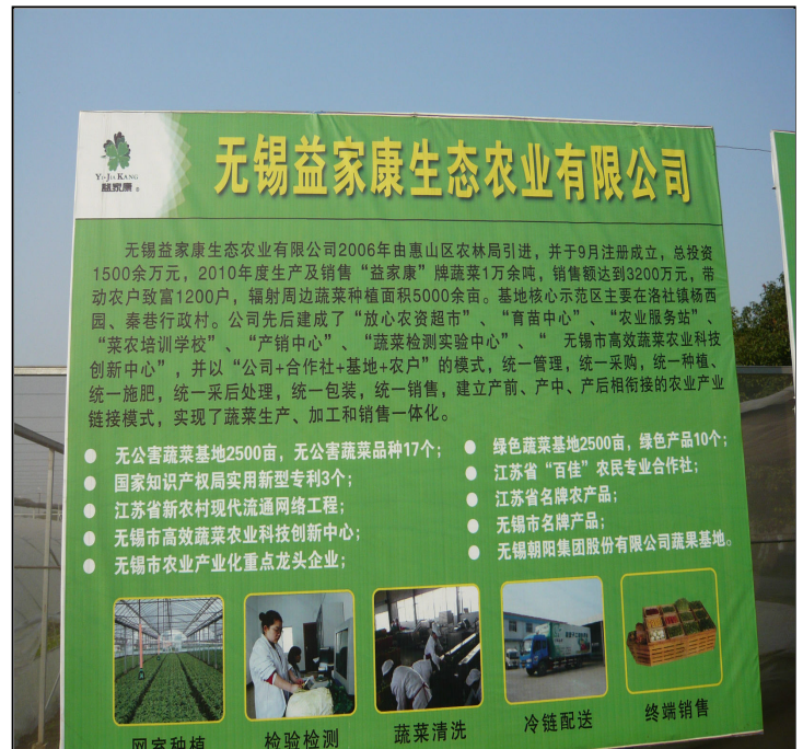
無錫益家康生態農業有限公司 社長