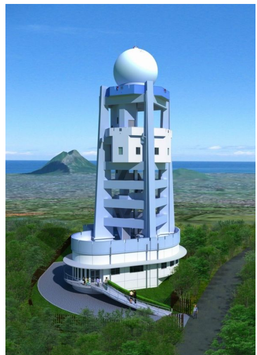
気象レーダー塔施設完成予想図