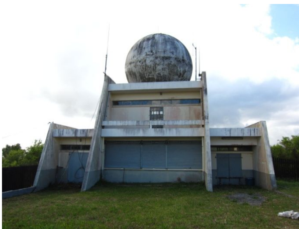
既存の気象レーダー塔施設 修理不能となり、完全に停止している。